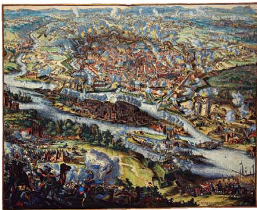
11. Romeyn de Hooghe, El sitio de Viena por los turcos , 1683, publicada en el Atlas Van der Hagen , ca. 1690. Imagen tomada de Behind Closed Doors. Art. in the Spanish American Home, 1492-1898 (Brooklyn y Nueva York: Brooklyn Museum/The Monticelli Press, 2013).

colecciones europeas sugieren que se trató de obras hechas por encargo. Así, la individualidad de las soluciones, lejos de ser casual, debió acordarse por los comitentes y los artistas.