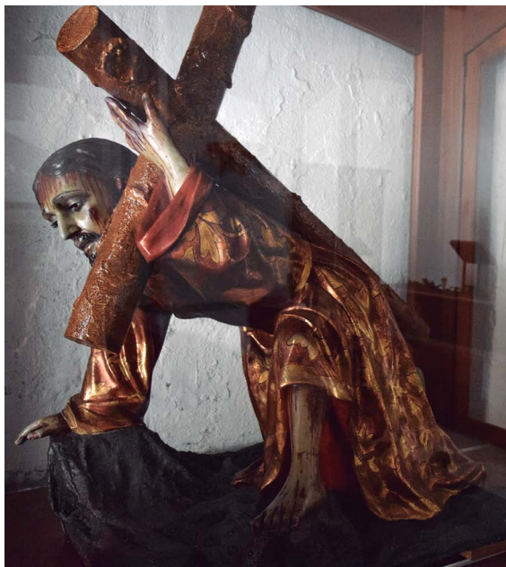
2. Anónimo, Nazareno, siglo XVII (?), escultura de madera policromada, ciudad de México. Hospital de Jesús.