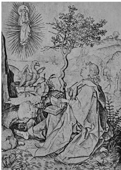
10. Martin Schongauer, San Juan escribe el Apocalipsis en la isla de Patmos , siglo xv, buril sobre metal. Biblioteca Real de Bruselas, Gabinete de Estampas, cat. 36028.

tinuidad entre el perfil de la nariz y las cejas. En ambos ejemplos, la cara de los ángeles se representa de medio perfil, sólo que el ángel de la imagen flamenca mira hacia el lado derecho a la vez que el de la mexicana, hacia el izquierdo.