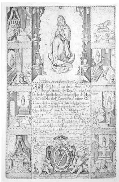
16. Samuel Stradanus, Los milagros de la Virgen de Guadalupe , calcografía, ca. 1622. Colección Museo Franz Mayer.