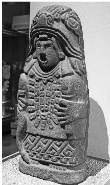
20. Escultura de la diosa Tonantzin como Cihuacóatl, escultura náhuatl, ca. 1500. Museo Nacional de Antropología e Historia, México.