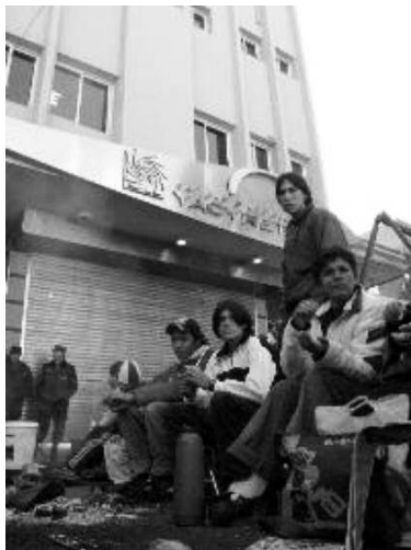
Relocalizados realizando un acampe frente a la sede binacional en reclamo de inmediatas soluciones sociales y económicas (2007)

CUADERNO URBANO. Espacio, Cultura, Sociedad – VOL. 9 – Nº 9 (Octubre 2010) pp. 91-109. ISSN 1666-6186