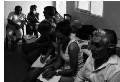
Reuniones con los vecinos

Aparecen en escena nuevos actores sociales, como referentes locales, generando una expresión de necesidad compleja que manifiesta una problemática en la que se superponen condiciones clásicas de carencia material con condiciones poco consideradas de potencialidad humana. Las prácticas y saberes construidos a partir de experiencias endógenas, colectivas e individuales, hacen presuponer producciones de solución diferentes de las imaginadas en el inicio del proyecto y se vuelven ineludibles en el marco de la indagación iniciada.