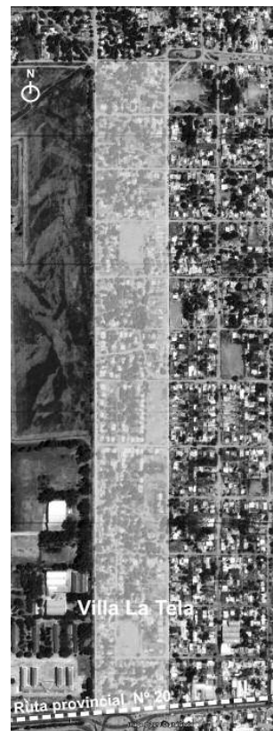
Villa La Tela.