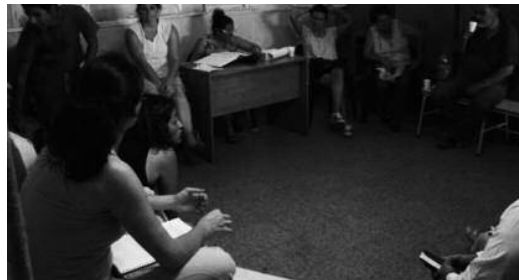
Reuniones con los vecinos

La situación problemática inicial, de mejoramiento barrial y regularización dominial, comienza a calificarse como una obviedad excesiva, y paralelamente a esto aparecen en el territorio, producciones de sentido subyacentes de la propia comunidad barrial que evidencian otros y nuevos relatos de verdad y necesidad. El problema inicial comienza a deconstruirse para dar lugar a una nueva noción de problema, surgida de la apelación de los propios vecinos, en compañía del equipo de investigación.