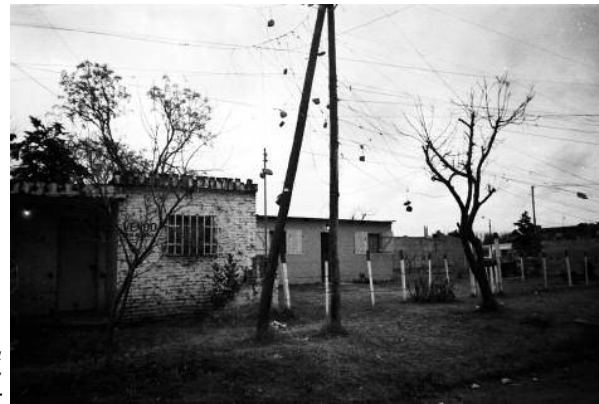
Villa La Tela Fuente: Peyloubet, 2006. Tesis Doctoral: "Hábitat Popular

El equipo de investigación inicia el proyecto adhiriendo a ciertos presupuestos técnicos consabidos, resultados de diagnósticos realizados por un sector académico, CyT, y político, datos municipales del plan director para la ciudad, que caracterizan las zonas pobres, en términos de carencias materiales, y que permite reconocer áreas vulnerables donde es previsible intervenir con mejoramientos barriales, vinculados tanto con viviendas como con la realización de infraestructura básica, emulando el modelo de planificación brasileño