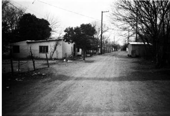
Villa La Tela