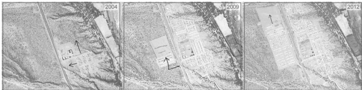
Figura 6. Esquema de la expansión del loteo Cachacito a partir de las tomas de tierra realizadas. Fuente: elaboración propia sobre la base de imágenes Google Earth, 2004, 2009 y 2012