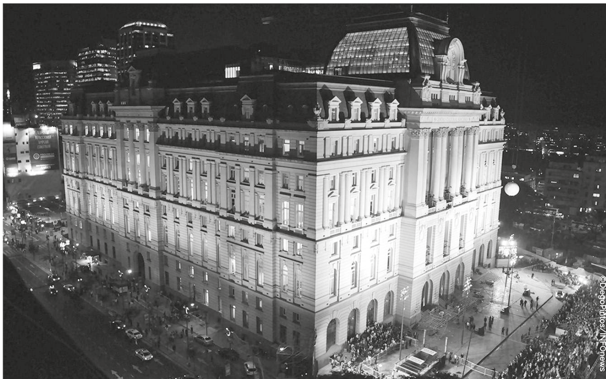
Centro Cultural del Bicentenario, luego denominado Centro Cultural Néstor Kirchner