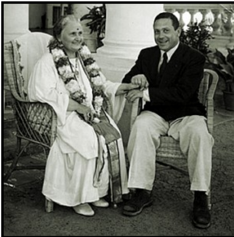
Imagen 2 María Montessori con su hijo Mario en Adyar, India