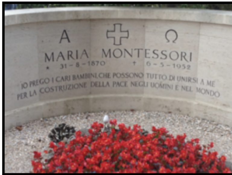
Imagen 5 Tumba de María Montessori (1870-1952)

Fuente: Fotografía del personal de este artículo.