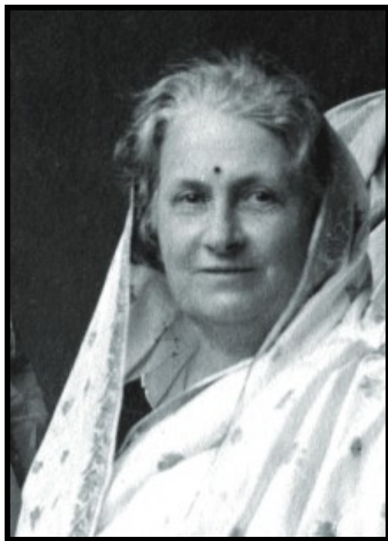
Imagen 4 María Montessori, s. f.

Fuente: Archivo de la Sociedad Teosófica en Adyar, India.