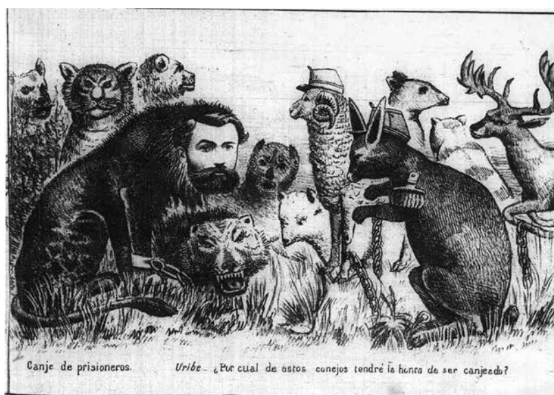
Figura 2. El Barbero (Santiago). Noviembre 15 de 1879.

Semanas después, tras la culminación de la primera fase de la invasión a la provincia salitrera de Tarapacá, donde los chilenos se hicieron de los ingresos necesarios para continuar la guerra, El Barbero publicó el 29 de noviembre de 1879 una caricatura donde el ministro Domingo Santa María coloca al servicio de la República de Chile a una nueva criada, la del Perú, haciendo hincapié en cuánto dinero ha ocupado en ella, refiriéndose a los innumerables gastos desembolsados a propósito de la guerra. La representación femenina de Chile agrega que su sirvienta le parece, además de costosa, descocada y zafada. Ambas repúblicas son caracterizadas como mujeres, en una versión autóctona y recatada de la Marianne de la Revolución Francesa de 1789 7 . La del Perú porta en su cabeza un sol, con seguridad alusivo a Inti, denominación quechua del astro rey, máxima deidad inca. Se encuentra vestida con ropas del bajo pueblo, caracterizada como una chola, en