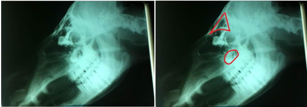
Figura 4. Placas radiográficas con medio de contraste (5 ml). Vista latero-lateral de la cabeza de una alpaca adulta. La vista del lado derecho muestra el seno frontal (triángulo superior) y el seno maxilar (recuadro inferior)