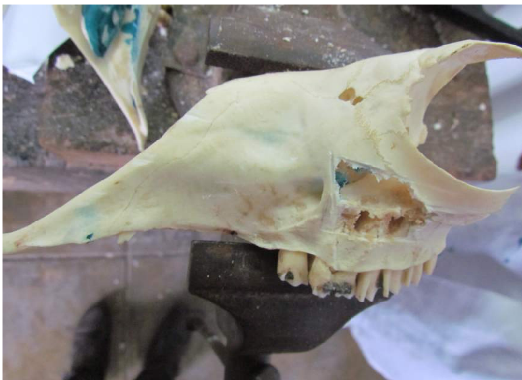
Figura 3. Puntos de referencia del seno maxilar. 1. Rostral, línea transversal al agujero infraorbitario ; 2. Ventral, línea imaginaria paralela al agujero infraorbitario ; 3. Caudal, borde ventral de la órbita ; 4. Dorsal, línea imaginaria a la mitad del hueso cigomático ; A. Agujero infraorbitario ; B. Hueso cigomático

infraorbitario, ventralmente por una línea imaginaria paralela al agujero infraorbitario, caudalmente con el borde ventral de la órbita y dorsalmente con una línea imaginaria a la mitad del hueso cigomático (Fig. 3).