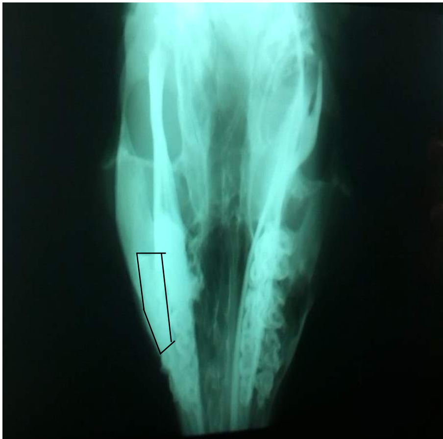
Figura 5. Placa radiográfica con medio de contraste (5 ml) del cráneo de una alpaca, vista dorso-ventral, donde se observa el seno maxilar (recuadro)