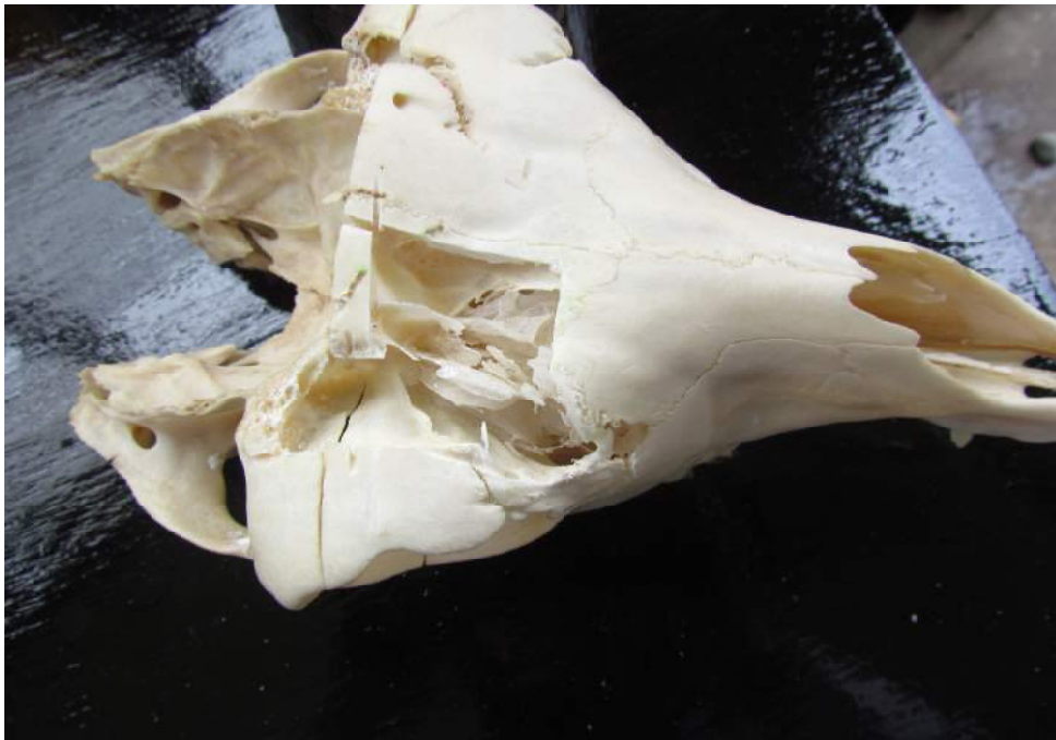
Figura 2. Puntos de referencia de los senos frontales de la alpaca. Límites del seno frontal medial: 1. Línea paralela a la sutura frontal; 2. Altura del agujero supra-orbitario; 3. Sutura frontal; 4. Hueso nasal; Límites del seno frontal lateral: 1. Línea paralela a la sutura frontal; 5. Altura de la fontanela lagrimal; 6. Borde supraorbitario; 7. Caudal al agujero supraorbitario (0.5 cm)

El agujero infraorbitario se localizó ventralmente al seno maxilar. Este se comunicó con la cavidad nasal a través de meato nasal ventral por la abertura nasomaxilar. El seno maxilar se limitó rostralmente por una línea imaginaria transversal al agujero