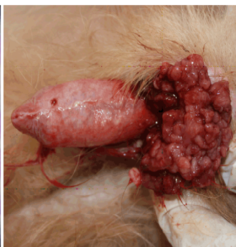
Figura 3. Típico nódulo multilobulado sangrante en la base de pene de un perro, con diagnóstico citológico y por PCR de tumor venéreo transmisible canino (TVTc)