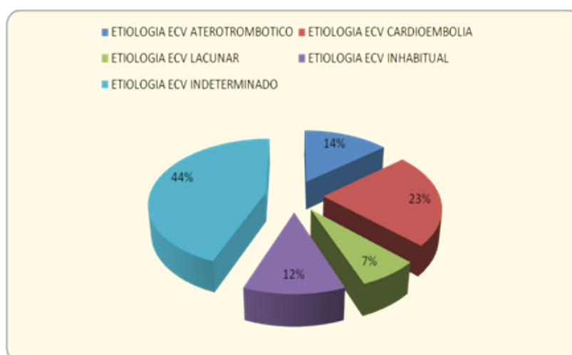
Gráfico 1. Etiología de pacientes con infarto cerebral en adultos jóvenes del Instituto Nacional de Ciencias Neurológicas, 2010-2013