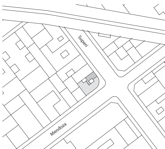
PLANTA EMPLAZAMIENTO E 1: 2.000