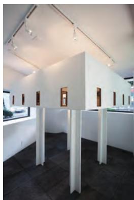
El museo en LIGA.