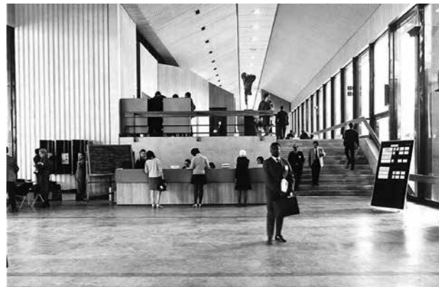
FIG 5 Edificio UNCTAD III. Hall principal / Main hall.