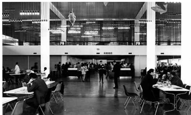
FIG 15 Edificio UNCTAD III. Comedor / Dining hall.

dios de comunicación conservadores, plantearon directamente la venta abierta para la especulación inmobiliaria. Uno de los planteamientos que provocó mayor rechazo fue la declaración de Vivianne Blanlot –en ese entonces Ministra de Defensa– diciendo que ya estaba decidido vender el edificio (Herman, 2010). A esto se sumaron las declaraciones de influyentes arquitectos que, en la portada del suplemento Artes y Letras del diario El Mercurio , planteaban que la mejor opción era eliminar la parte de la construcción que no había sido afectada por el incendio. 4