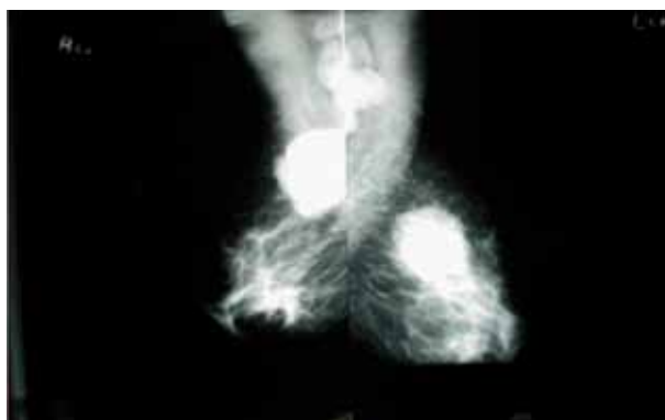
Figura 7. Enfermedad de Paget y mamografía.