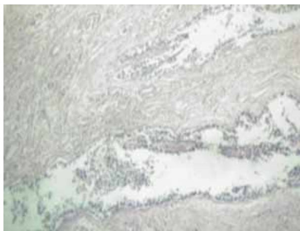
Figura 1, 1a y 1b. Representación histológica de la teoría epidermotrópica y la célula de Paget.