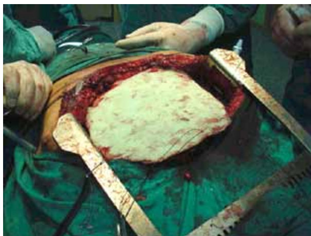
Figura 3, 4, 5, 6. Casos clínicos de enfermedad de Paget.