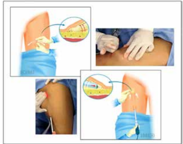
Figura 2. Creación del espacio de trabajo.

Se colocan los dos primeros puertos robóticos de 8 mm guiados manualmente con los dedos, lateral y medialmente. Y un trocar adicional de 10 mm entre la cámara y el puerto primario medial. El carro del robot se colocó al lado opuesto de la región inguinal del paciente en un ángulo 45° (Figura 3).