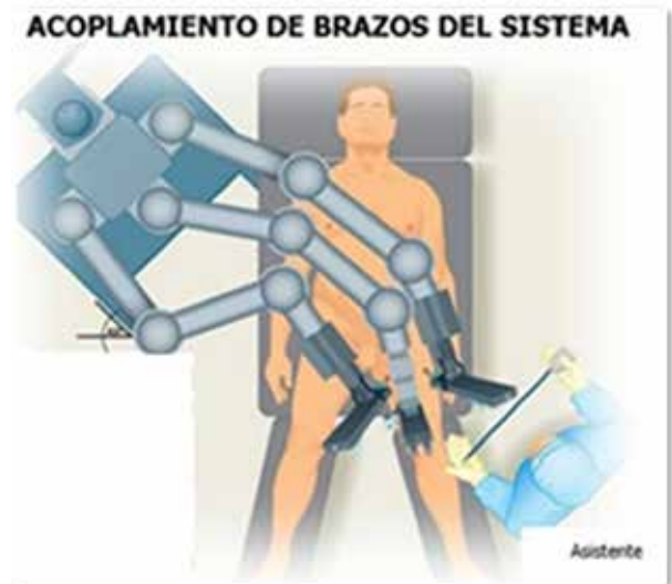
Figura 3. Colocación del carro del robot.

Se colocan los dos primeros puertos robóticos de 8 mm guiados manualmente con los dedos, lateral y medialmente. Y un trocar adicional de 10 mm entre la cámara y el puerto primario medial. El carro del robot se colocó al lado opuesto de la región inguinal del paciente en un ángulo 45° (Figura 3).