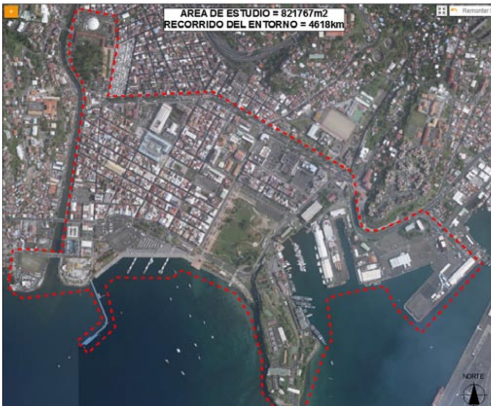
Figura 2: Delimitación del área de estudio