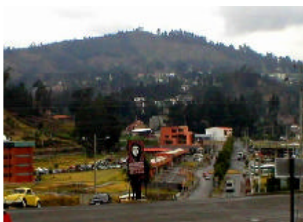
Avenida Ernesto Ché Guevara.