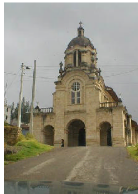
Iglesia de las Flores.