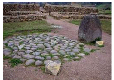
Sector de Pilaloma.

Ingapirca, es considerado como el conjunto arqueológico prehispánico más importante de Ecuador. En su parte más alta, correspondiente al llamado Castillo de Ingapirca, su cota alcanza los 3 160 m. Dentro de este complejo el edificio más antiguo, perteneciente a la cultura cañari es el llamado Pilaloma, de forma semielíptica y conformado por varias habitaciones rectangulares que posee en su centro un pavimento circular de piedras con una mayor y que era un enterramiento colectivo, cuyo personaje principal fue una sacerdotisa cañari. 3 Otro edificio importante es el Castillo o Templo de Sol; ubicado en un terraplén sobre un peñón natural, domina el lugar. Está constituido por un muro de forma