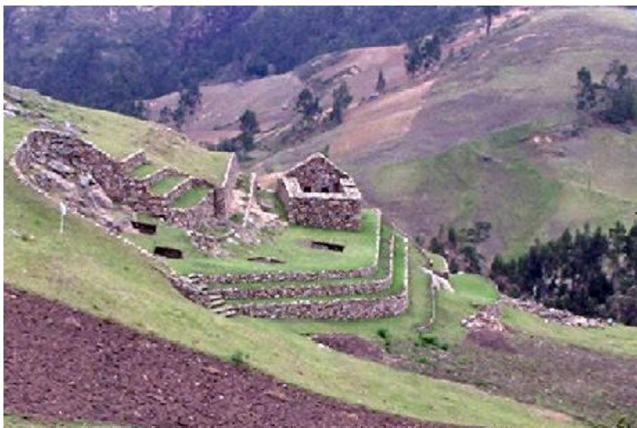
Área principal del sitio arqueológico de Cojitambo.