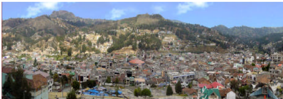
Vista general de Azogues.

La ciudad, ubicada en el valle del río Burgay-mayu, a la salida de la hoya del Paute y situada a 2 520 m de altitud promedio, es la capital de la provincia del Cañar, situada en el centro-sur de la República del Ecuador, siendo además cabecera cantonal de uno de los siete cantones de la jurisdicción provincial; cuenta además de las cuatro parroquias de la zona urbana, con ocho parroquias rurales. Su población, según el censo del año 2000, se estimaba en 34 910 habitantes.