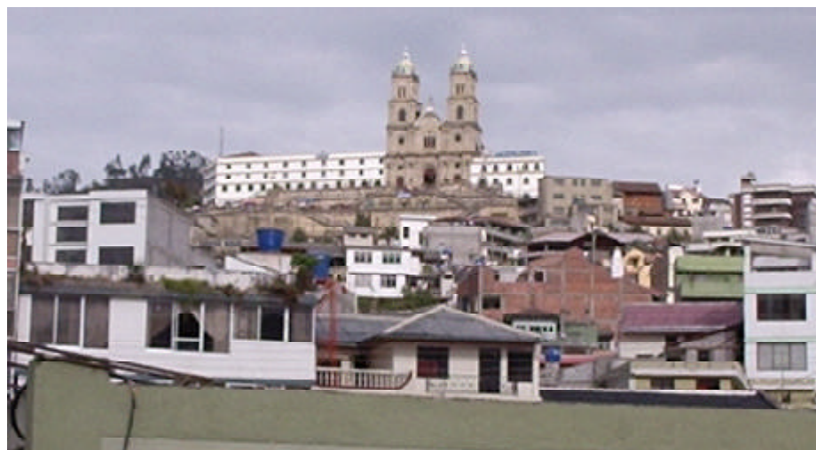
Iglesia y convento de San Francisco.