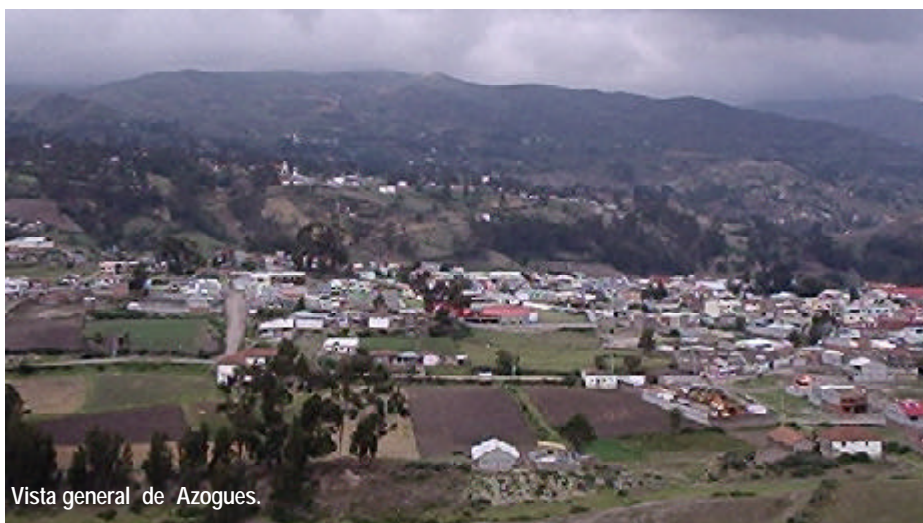
Vista general de Azogues.