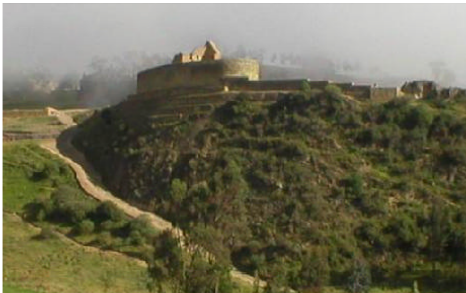
Ingapirca. El Castillo o Templo del Sol.

AAVV: Libro de Azogues , Municipalidad de Azogues, Azogues, 2003.