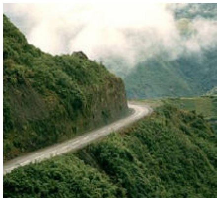
La carretera hacia Azogues.