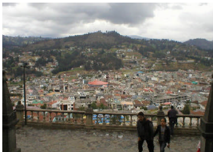
Azogues vista desde el conjunto franciscano.