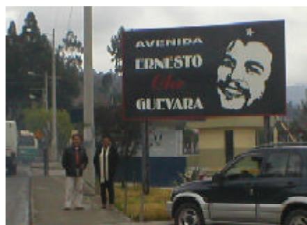
Letrero que identifica la Avenida Ché Guevara.