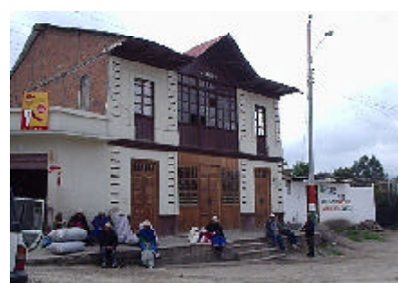
Arquitectura vernácula en las parroquias de Azogues.