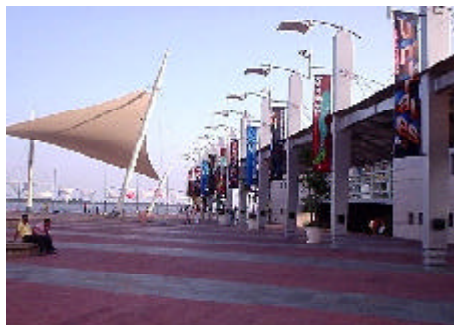
El Malecón 2000, en Guayaquil.