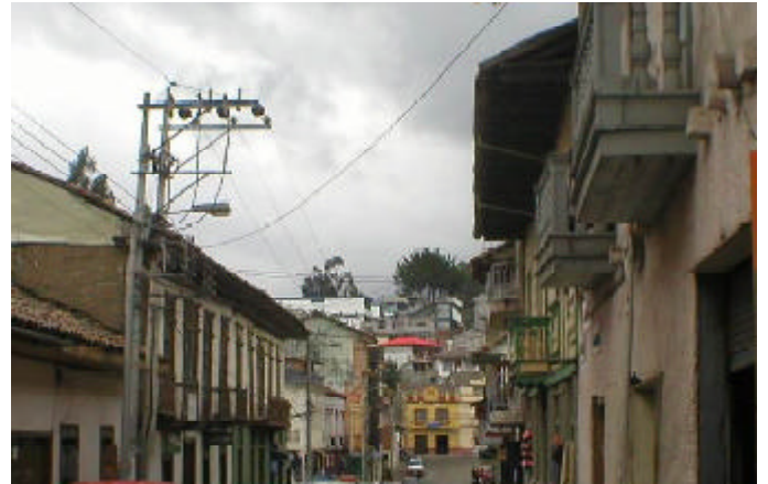
Área tradicional de Azogues.

En la traza de la ciudad permanecen pocas edificaciones de la etapa de la colonia, pero hay interesantes construcciones eclécticas. También en el centro se han insertado edificios más cercanos en el tiempo. En el área más tradicional de la ciudad se destacan los balcones con balaustres