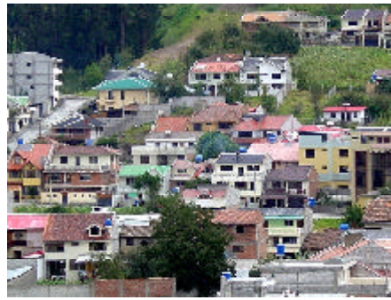
Aparecen modelos importados por migrantes o elementos que se ponen de moda: tanques azules de PVC.