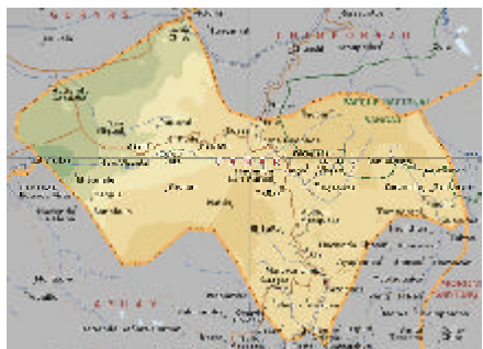
Mapa de la provincia Cañar.

Después de cerca de 200 km, se llega finalmente a San Francisco de Peleusí de Azogues, declarada Patrimonio Cultural y Urbano del Ecuador en el año 2000.