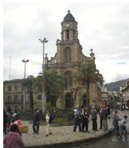
Iglesia matriz de Azogues.