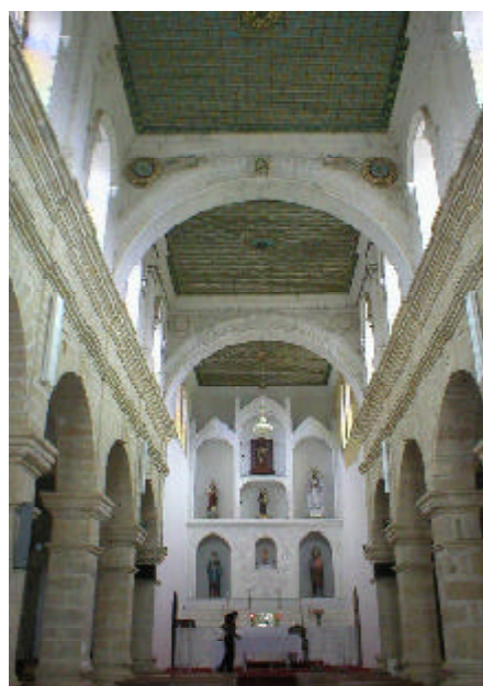
Interior de la Iglesia de las Flores.