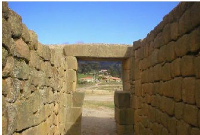
Ingapirca. Entrada a los aposentos.