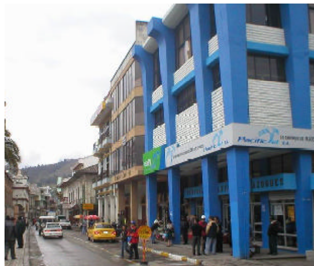
Arquitectura nueva y vieja en el centro de Azogues.