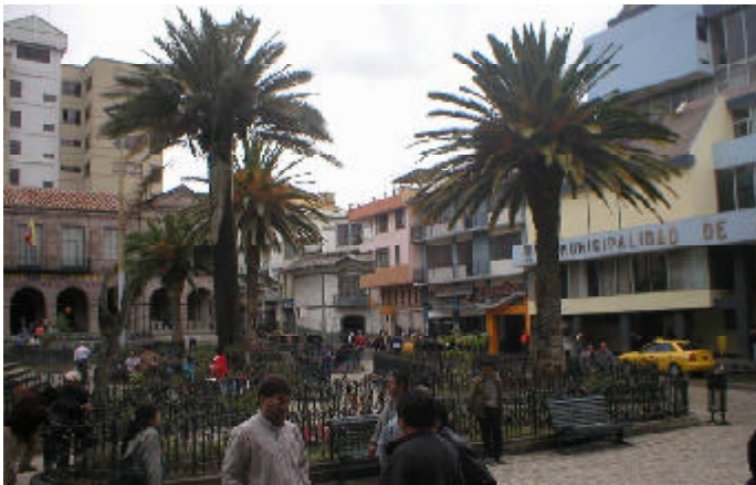
Plaza central de Azogues.