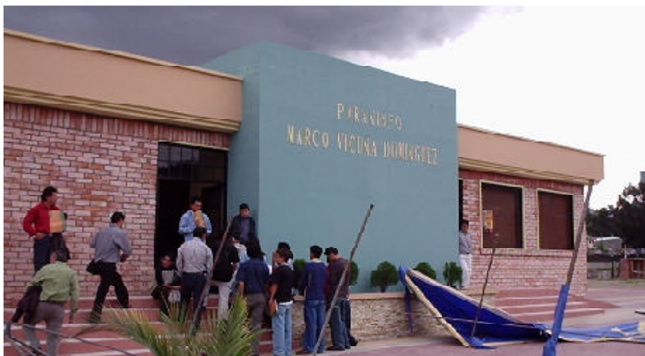
El paraninfo de la Universidad Católica de Azogues.