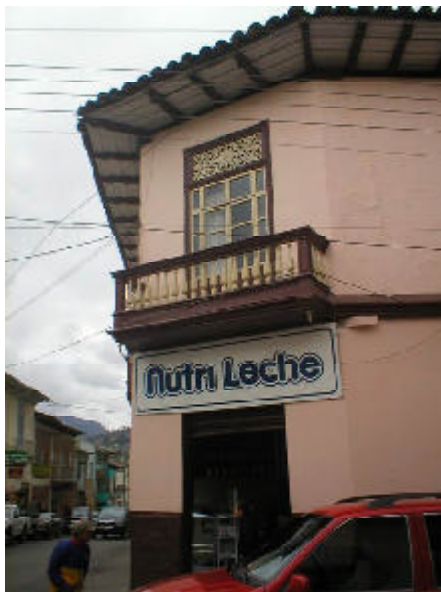
Edificaciones con balcones de madera, amplios aleros y celosías hábilmente trabajadas..

de madera, los avanzados aleros y las puertas y ventanas con bellas celosías caladas en la parte superior. Hoy la ciudad se debate entre el abandono de parte de la población que ha emigrado a Europa o Estados Unidos, buscando una mejoría económica, y un crecimiento que rompe con la tradición a partir de los modelos impuestos por los migrantes, o elementos que superponen, generalizándose como moda. Ese crecimiento también deparaba una sorpresa para las cubanas: La Sociedad de Amistad con Cuba había logrado nombrar Avenida Ché Guevara a una de las arterias de la ciudad.