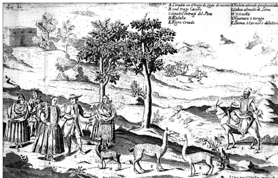
Figura 2. Antonio de Ulloa y Jorge Juan. Ilustración: Descripción de los habitantes del Perú. Relación histórica del viaje a la América Meridional, hecho de orden de S. Mag. para medir algunos grados de meridiano terrestre, y venir por ellos en conocimiento de la verdadera figura, y magnitud de la tierra, con otras varias observaciones astronómicas, y físicas (Madrid 1748, tomo III, página 82). El grabado, con las leyendas propias de los geógrafos de la ilustración muestra un orden natural del territorio, parte de ello, lo constituyen las castas que pueblan el Perú. Las descripciones de Antonio de Ulloa y Jorge Juan fueron muy sugestivas para los ilustrados peruanos. En su discurso ‘Decadencia y Restauración del Perú’, Unanue cita en varias oportunidades a Ulloa, de quien toma las vívidas imágenes de desolación y despoblamiento del país.

“Hoy el Perú parece decidido a seguir con fe y perseverancia el camino del progreso. Cuenta con elementos bastantes para alcanzar en el un puesto avanzado. A más de los recursos infinitos con que ha prodigado la naturaleza a nuestro suelo, poseemos las enseñanzas y la triste experiencia por la historia de casi un siglo de error y amargura. Es pues, ya tiempo de aprovechar tan ricos dones, de convertir en reales las riquezas que hasta hoy permanecen en estado potencial; para ello no nos es necesario inventar ni ideas, ni principios, ni métodos ni procedimientos, basta que querramos repetir lo que han hecho ya las demás naciones para llegar a la altura en que se encuentran...” (27)