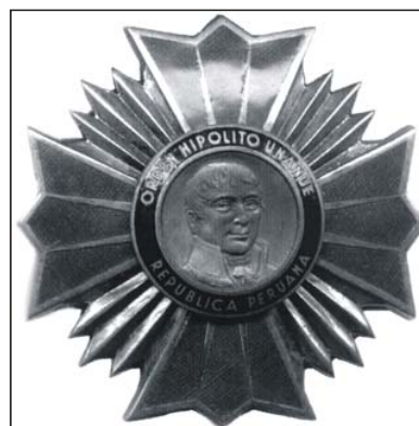
Figura 6. Condecoración de la Orden “Hipólito Unanue”.