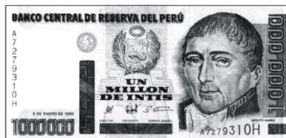
Figura 9. Anverso del Billete de Un Millón de Intis que presenta la imagen de Hipólito Unanue.