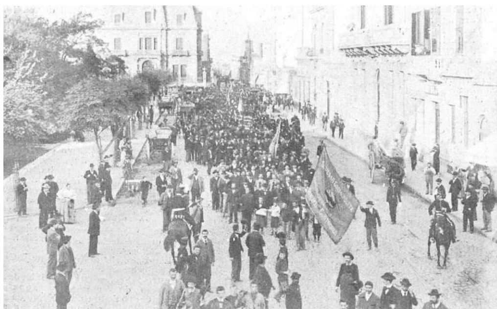
5. Desfile socialista por el 1° de Mayo en Buenos Aires, "en corporación" por calle Cerrito.