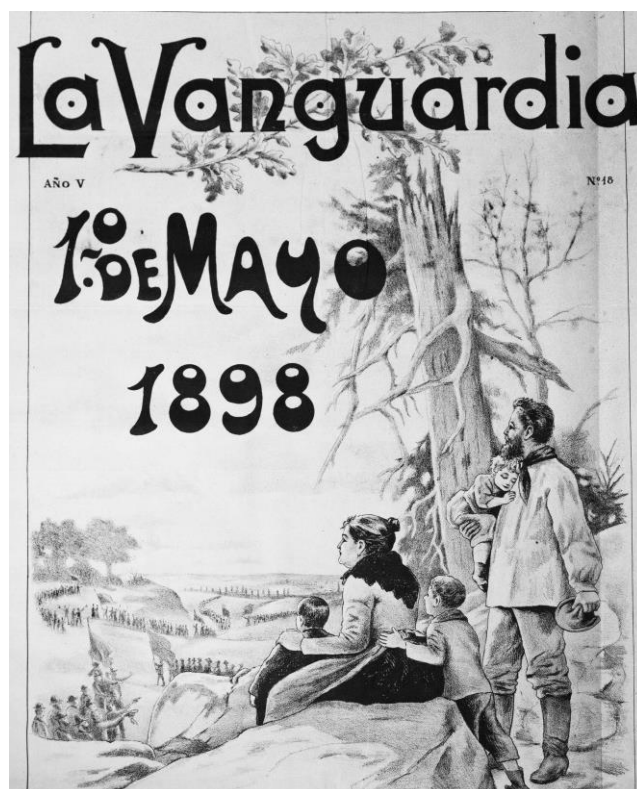
3. Portada del número especial de La Vanguardia para el 1º de Mayo.