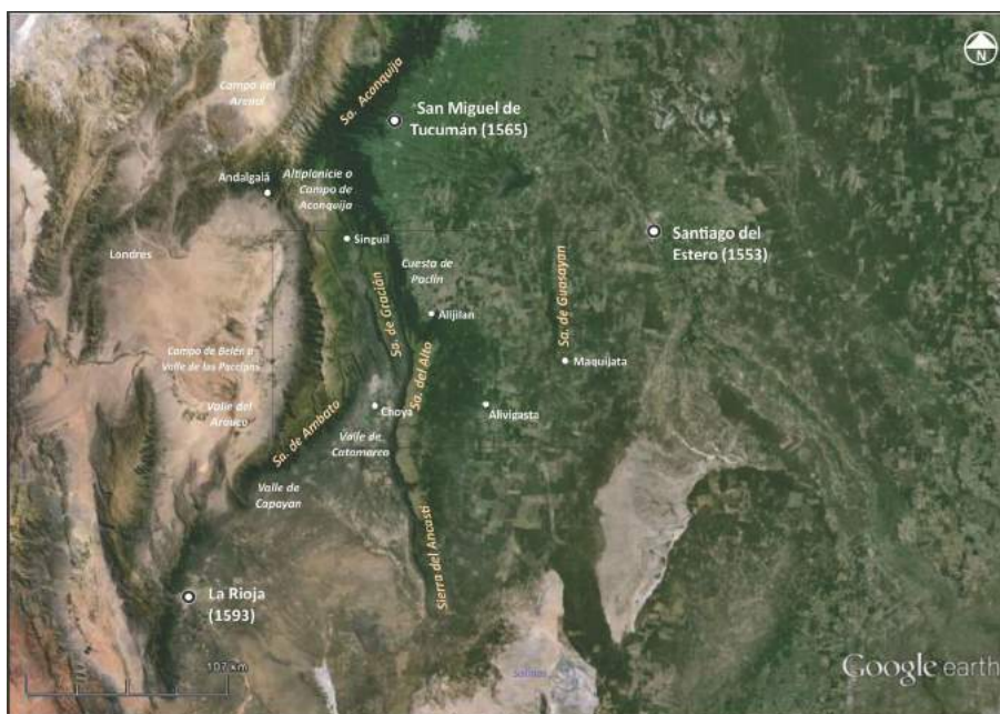
Mapa I: La Sierra de Santiago y el Valle de Catamarca

“En cuatro pueblos que hay desde donde se juntan las sierras de Londres [Ambato] y ésta [Ancasti-Alto] con otra sierresita para arriba [Gracian], que aunque es doctrina del valle hace angostura y luego ensancha dicho valle arriba hasta el pueblo de Gines de Lillo [Singuil] que todo se intitula Catamarca, que aunque he dicho a Vuestra Señoría no haber más de doce leguas, se entiende de lo angosto [hacia] abajo, que de allí [hacia] arriba hay otras catorce de mala tierra de andar porque se pasa un río veinte y dos veces para ir a estos cuatro pueblos y con las muchas aguas de este año no he podido pasar [...] y ahora he de entrar por la parte de Tucuman [cuesta de Paclin] porque el dicho rio no se puede andar parte de abajo...” 24