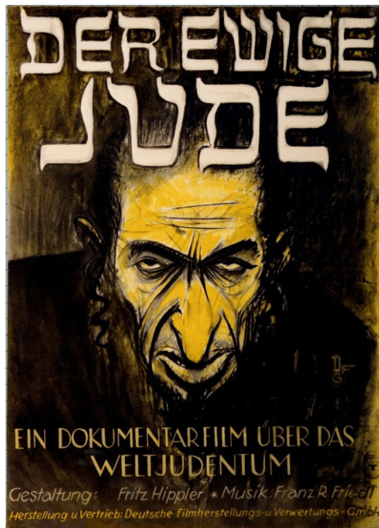
Afiche publicitario del documental Der ewige Jude (El Eterno Judío, 1940), dirigido por Fritz Hippler 33

filme como "parásito", y de este modo justificar las políticas de segregación racial que se estaban comenzado a implantar. Su cartel de promoción, creado por el reconocido diseñador gráfico Hans Schweitzer Mjölnir , quien fue comisario del Reich para el diseño artístico y es reconocido como uno de los propagandistas más destacados del nacionalsocialismo, destaca la representación que se hacía de los judíos como el mal a través de la oscuridad que domina la imagen y los rasgos notablemente marcados del personaje representado. El juego de sombras y las líneas que configuran la expresión del personaje dan por resultado un ser de rasgos agresivos, dueño de una mirada turbia que busca generar desconfianza en el observador y predispone al espectador sobre lo que va a ver. 32