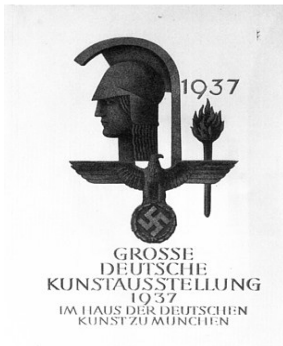
Cartel de la Gran Exposición del Arte Alemán (1937) 17

Por su parte, la promoción de la Gran Exposición de Arte Alemán fue plasmada en un cartel en el que la sobriedad con que se combinaron los elementos en juego transmite al espectador sensaciones de orden y asepsia, valores reivindicados por el régimen como propios del "arte verdadero", en oposición al caos del "arte degenerado". La distribución equilibrada de elementos familiares al nazismo sobre el fondo blanco en los que la antorcha portadora del fuego sagrado, el perfil inspirado en la belleza clásica y el águila que sostiene la esvástica preparan al espectador sobre el carácter solemne de las obras que va a presenciar.