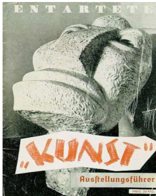
Cartel de la Exposición de Arte Degenerado (1937) 16

Ya la cartelería diseñada para la ocasión da cuenta de las ideas que guiaron cada una de las muestras. En la portada del catálogo de la Exposición de Arte Degenerado se exhibe una fotografía del busto del artista judío Otto Freundlich, El hombre nuevo (1912), que fue destruido por los nazis posteriormente. La obra es una pieza tallada en piedra en la que el rostro humano es representado a partir de la insinuación de sus rasgos, hecho que a simple vista permite ver la distancia entre esta y la perfección que admiraba el régimen en las esculturas inspiradas en la belleza griega clásica. La proximidad desde la que se retrató la escultura y el ángulo desde el que se la enfocó, agudizan la deformación de los rasgos humanos de la pieza, a la vez que las letras que presentan el catálogo, superpuestas sobre la fotografía de la obra y con una tipografía claramente descuidada, dan por resultado una imagen total saturada y distorsionada que favorece la identificación de las "obras degeneradas" como visiones enfermas de la realidad.