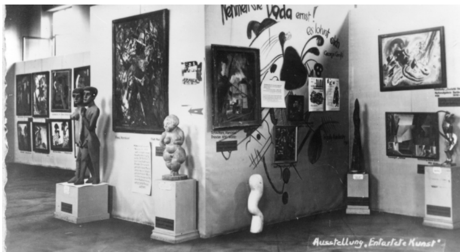
Toma de la exposición de Arte Degenerado. 1937 15

La intención de estas exposiciones fue ilustrar al público sobre la decadencia artística que significaron los movimientos de vanguardia surgidos entre finales del siglo XIX y los años veinte, atacando de este modo tendencias como el impresionismo, el expresionismo y el surrealismo, entre otros. Obras de reconocidos artistas como Dix, Grosz y Kandinski fueron distribuidas de forma caótica en el recinto de la exposición y acompañadas de frases pintadas en la pared que se hacían burla de los artistas, buscando generar en el público la sensación de confusión y desprecio por lo que se observaba. Junto a las obras fueron colgadas fotografías y dibujos de pacientes psiquiátricos con el fin de subrayar el carácter enfermo e inferior que se asignó a los artistas de la vanguardia.