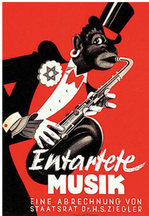
Cartel de la Exposición de Música Degenerada (1938) 27