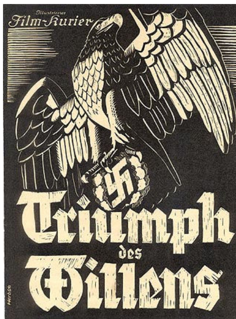
Afiche publicitario del documental Triumph des Willens El triunfo de la voluntad, 1935), realizado por Leni Riefenstahl 35

Por otra parte, el documental realizado por Leni Riefenstahl, Triumph des Willens (El triunfo de la voluntad, 1935), en el que se da cuenta de las jornadas del partido nacionalsocialista en Núremberg del año 1934, refleja claramente en sus escenas la relación que se dio entre estética y política durante este periodo. 34