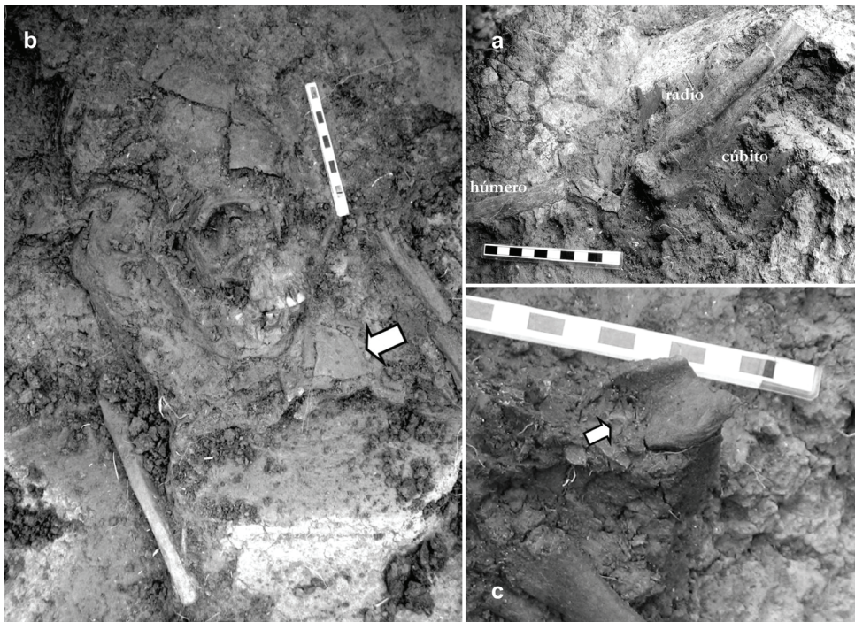
Fig. 2. a: Vista de la posición anatómica articulada de los huesos del brazo izquierdo; b: Detalle del aplastamiento y desplazamiento de piezas del cráneo (flecha indica ubicación del fragmento de cerámica sobre el tórax del individuo); c: Detalle del nódulo de ocre rojo hallado sobre el húmero izquierdo.

Considerando los indicadores etarios disponibles en la muestra, para la estimación de la edad al morir se siguieron los métodos presentados por Schehuer y Black (2000) para la fusión de las epífisis en huesos largos y el método de Brothwell (1981) que considera el desgaste dental como indicador. Si bien este último es controvertido, dado que en las poblaciones cazadoras-recolectoras el desgaste de la superficie oclusal está influenciado por el tipo de dieta y los resultados presentan grados variables de confiabilidad (Santini et al., 1990; Mays et al., 1995), se decidió utilizarlo para el individuo bajo estudio ya que no se contó con otros estimadores etarios tradicionales, como por ejemplo la obliteración de las suturas craneales (White y Folkens, 1991; Buikstra y Ubelaker, 1994). Este método no pudo aplicarse debido al grado de aplastamiento, deformación y fragmentación del cráneo, productos de procesos