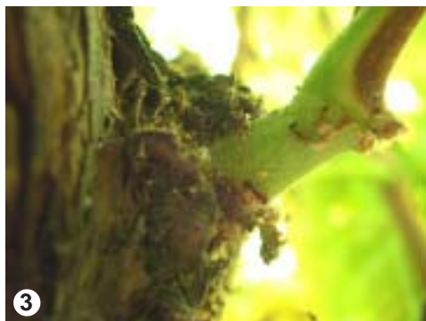
Asociación de hormigas con cochinillas