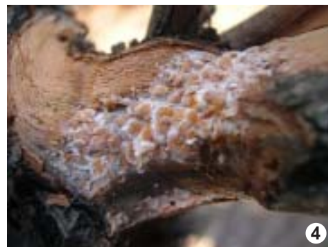
Colonia de cochinilla harinosa bajo la corteza