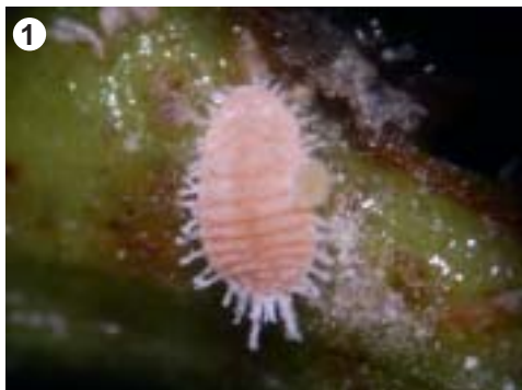
Hembra de Planococcus ficus Signoret

La actividad de la plaga comienza a fines de agosto - principios de setiembre con un aumento en el número de ninfas de primer estadio a mediados del último mes. En el presente trabajo se registra la primera generación, cuando el insecto se encuentra situado bajo la corteza, en el tronco, movilizándose hacia la parte superior del mismo. (foto 4). La duración aproximada de este ciclo es de dos meses. La presencia de ninfas de primer estadio se mantiene en proporción elevada durante la primera quincena de octubre debido a que la eclosión de huevos invernales se desarrolla en forma escalonada. En esta etapa se detecta la presencia de cochinillas en brotes y bajo la corteza, en la base de pitones y sarmientos. Durante esta generación se produce una importante dispersión de la plaga.