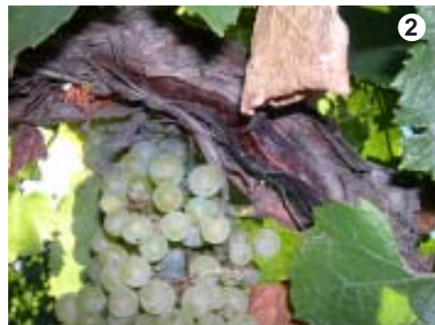
Manchas de humedad en corteza