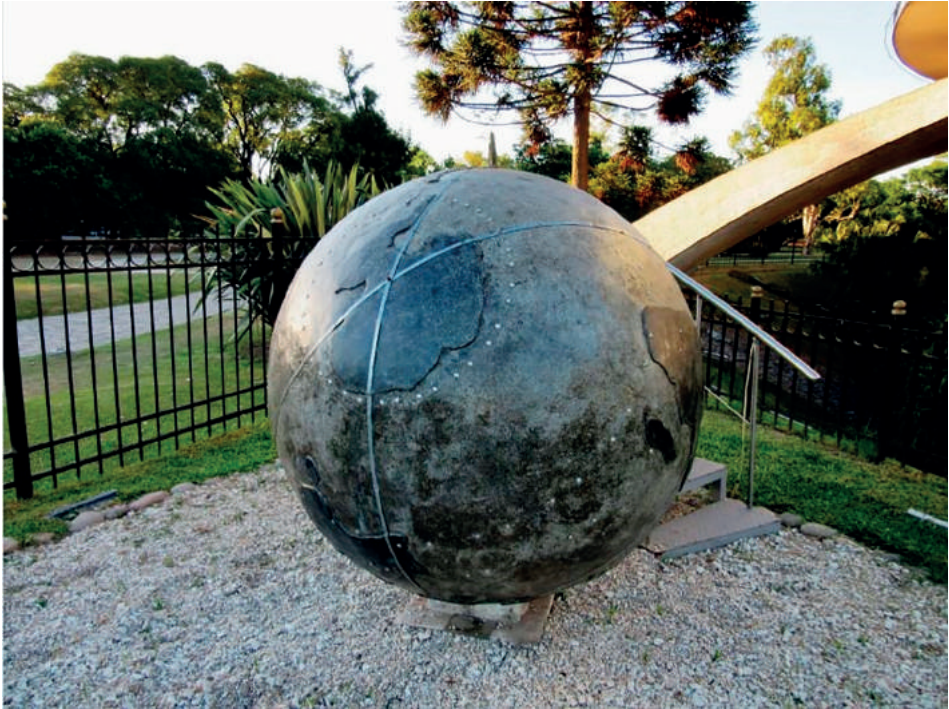
Figura 7. Globo terráqueo paralelo. Representación del mundo en la posición real desde Buenos Aires en la parte superior (una miniatura del Obelisco ejemplifica la ubicación). Se aprecia en primer plano el Polo Sur y el extremo sur de África y Australia. Globo terráqueo paralelo en el Planetario “Galileo Galilei” de la Ciudad de Buenos Aires.

En este contexto, la razón aparece como la principal fuente del conocimiento científico al minimizar la arbitrariedad en el momento de realizar generalizaciones no contradictorias y avanzar hacia la construcción de conocimientos científicos. Esto resulta posible porque existe una materialidad independiente del observador que brinda objetividad (Rand, 2011) y es por eso que es posible verificar claramente que el análisis de la realidad puede orientarse, utilizando conceptos de Soros (2010), hacia una función cognitiva dejando de lado una función de manipulación, esta última vinculada a la actividad política.