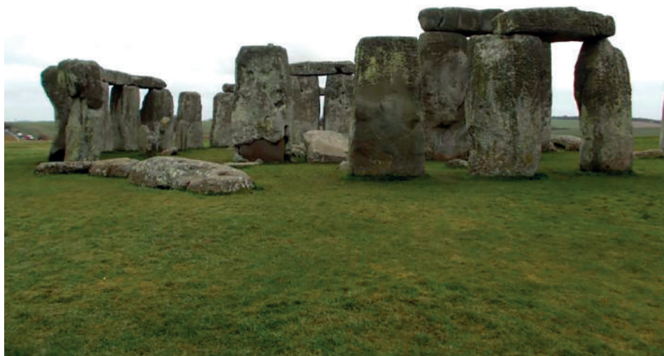
Figura 1. Observatorio astronómico en el neolítico. Stonehenge (Wiltshire, Inglaterra) fue utilizado como observatorio astronómico, el movimiento de la sombra del Sol a lo largo del año permitía predecir las estaciones.