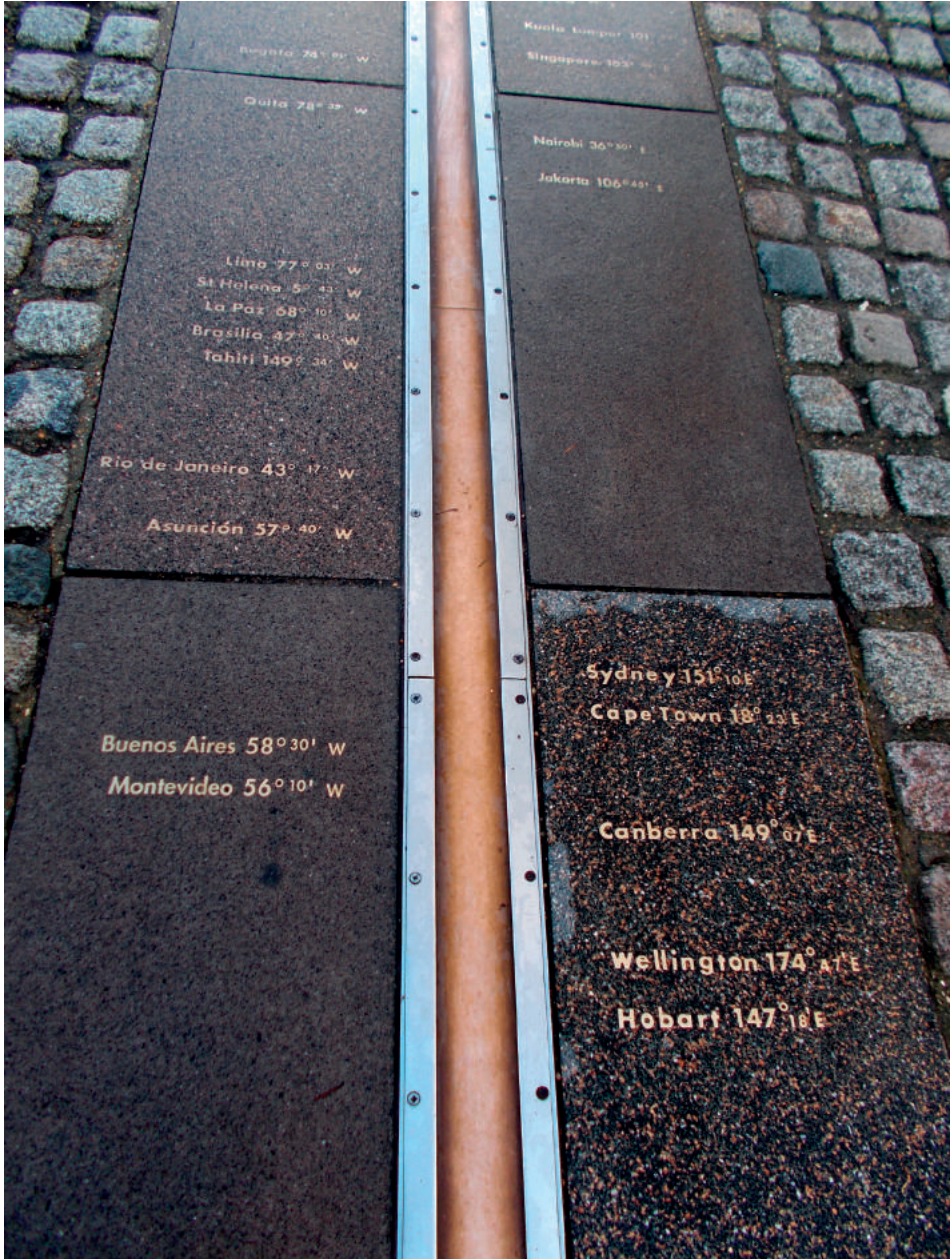
Figura 6. Trazado de la línea del Meridiano de origen. Línea del Prime Meridian , a ambos lados se hace referencia a las longitudes de diferentes ciudades capitales de países. Del lado izquierdo (Oeste) y de abajo hacia arriba aparecen Montevideo, Buenos Aires, Asunción, Río de Janeiro, Tahití, Brasilia, La Paz, St. Helena, Lima, Quito y Bogotá.