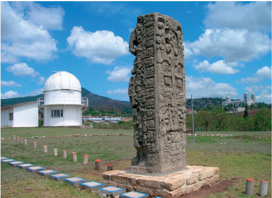
Figura 2. Arqueoastronomía y observatorio astronómico en la Universidad Nacional Autónoma de Honduras (UNAH). Estela maya del gobernante 18° Conejo de Copán en el Observatorio Astronómico de la Universidad Nacional Autónoma de Honduras (UNAH). Predicción de eventos naturales terrestres a través de la evolución de las sombras a lo largo del año (marcado en el terreno). Suyapa, Tegucigalpa, Honduras.

El Sol es nuestra estrella más cercana, alrededor de la cual se afirmaba que giraban nueve planetas: Mercurio, Venus, la Tierra, Marte, Júpiter, Saturno, Urano, Neptuno y Plutón. Era fácil memorizar estos pocos nombres y, de esta manera, era posible sentir que el conocimiento llegaba muy lejos, ya que Plutón se encuentra aproximadamente a 5.750 millones de kilómetros de nosotros. Podía experimentarse esa sensación cuando hace cuatro décadas eran leídos libros introductorios de Astronomía como El Sistema Solar (Vidal, 1973) publicación de gran divulgación en nuestro país y que actualmente merecería una importante actualización.