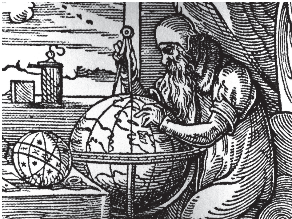
Figura 3. Astrónomo realizando mediciones en el globo terráqueo Der Astronomus (1568), Jost Amman (1539-1591), Eygentliche Beschreibung aller Stände auff Erden, Frankfurt am Mayn, Deutschland. (Detalle), Goldenes Dachl, Innsbruck, Austria.

El tiempo transcurrido, que para la historia del universo casi no existe y para la historia de la humanidad es ínfimo, para la evolución del conocimiento puede representar mucho, a tal punto que actualmente se debe asimilar el hecho de no estar en el mismo sistema solar y tampoco en la misma galaxia que nos habían presentado aquellas publicaciones. Hace cuatro décadas el sistema solar se conocía con 9 planetas y hoy tiene 13 (agregándole Ceres, Haumea, Makemake y Eris), Júpiter tenía 12 satélites y hoy tiene 63, había solo 8 planetas vecinos y hoy se conocen casi 2.000 planetas extrasolares. La Vía Láctea, nuestra galaxia, estaba formada principalmente por estrellas dispuestas en una estructura espiral y ahora se sabe que su mayor componente son planetas y que su forma es una espiral barrada.