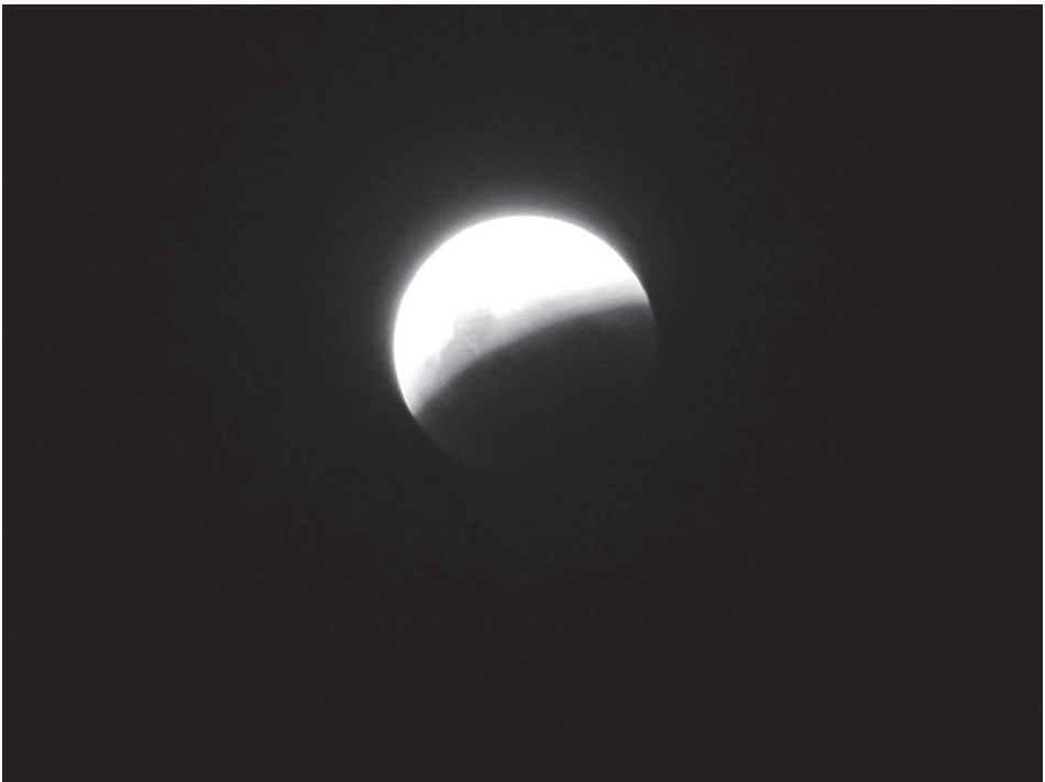
Figura 4. El universo como sistema: eclipse lunar 2015. Predicción a través de leyes científicas. Eclipse lunar del 27 de setiembre de 2015. La Tierra muestra su curvatura proyectando parcialmente su sombra sobre la Luna.

Sagan (1995) nos dice que sin generalizar sería imposible conocer la realidad. También señala que el descubrimiento de las leyes del funcionamiento del mundo es producto del método científico, un método de gran simplicidad que se encuentra compuesto por tres instancias principales (Russell, 1985): la observación de los hechos significativos, la generalización de las observaciones para la formulación de leyes y modelos y, finalmente, la comprobación que puede ser realizada hacia nuevos casos que nos propone la realidad.