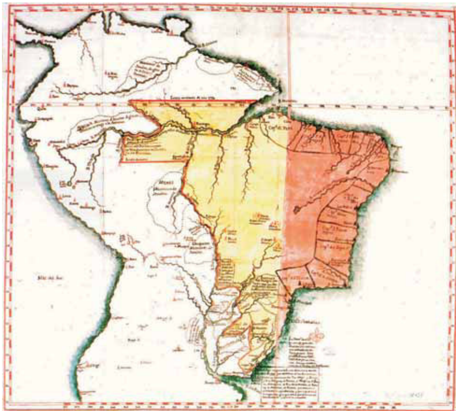
Figura 4. [América del Sur], 1759, Archivo General de Simancas, M. P. y D., IV – 36.

Contudo, após o exame do Mapa das Cortes a postura de Carvajal e Lancaster perante a proposta portuguesa alterou-se repentinamente. Depois de um aparente impasse no avanço da negociação, questionado pela rainha espanhola Maria Bárbara de Bragança, filha de D. João V, sobre o que esperar das conferências com o ministro português assegurou-lhe “que as disposições eram as melhores para esperar bom sucesso da nosa negociaçam”. 50