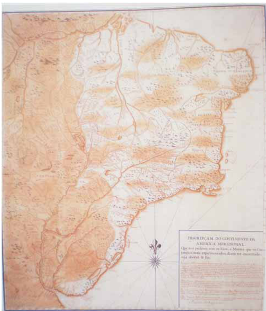
Figura 3. Descripçam do Continente da America Meridional...