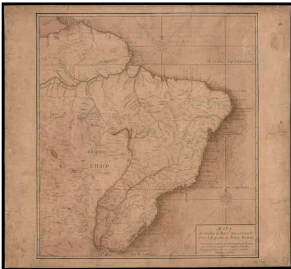
Figura 1: Mapa das Cortes.

Para a elaboração do Mapa das Cortes foram utilizadas diversas fontes, enumeradas por Marco António de Azevedo Coutinho (na verdade por Alexandre de Gusmão) numa carta dirigida a Tomás da Silva Teles. 12 Elas foram variadas quanto às suas características, à sua proveniência e ao seu rigor científico. A par da cartografia jesuíta, dos mapas de La Condamine ou do Padre Diogo Soares, encontramos informações de missionários, “memórias de viandantes”, “relações, e riscos de alguns mineiros”. Por outro lado, a região localizada entre o rio Amazonas e a Província de Charcas foi traçada no Mapa das Cortes de forma idealizada, sabendo-se apenas que os grandes rios afluentes do Amazonas tinham origem naquela região e que uma cordilheira acompanhava o grande rio de leste a oeste. 13