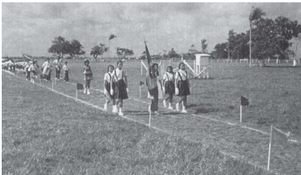
Figura 1: Desfile de 7 de Setembro dos alunos na fazenda Tapera, na cidade de Soure (PA), s.d.