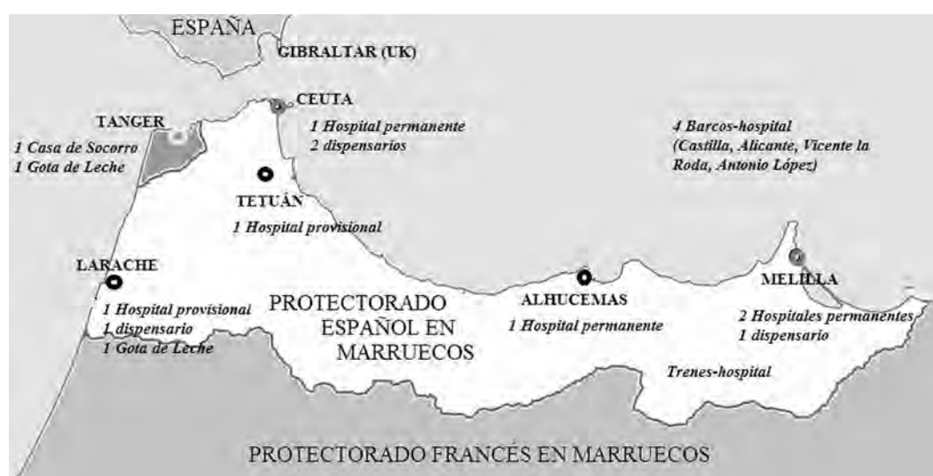
Figura 3: Mapa de los establecimientos de Cruz Roja española en Marruecos, Ceuta y Melilla en 1927 (elaboración propia)