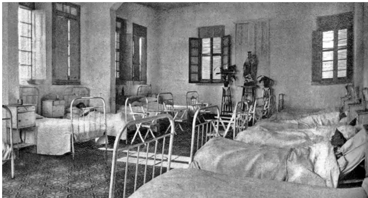
Figura 4: Sala del hospital de la Cruz Roja española en Melilla