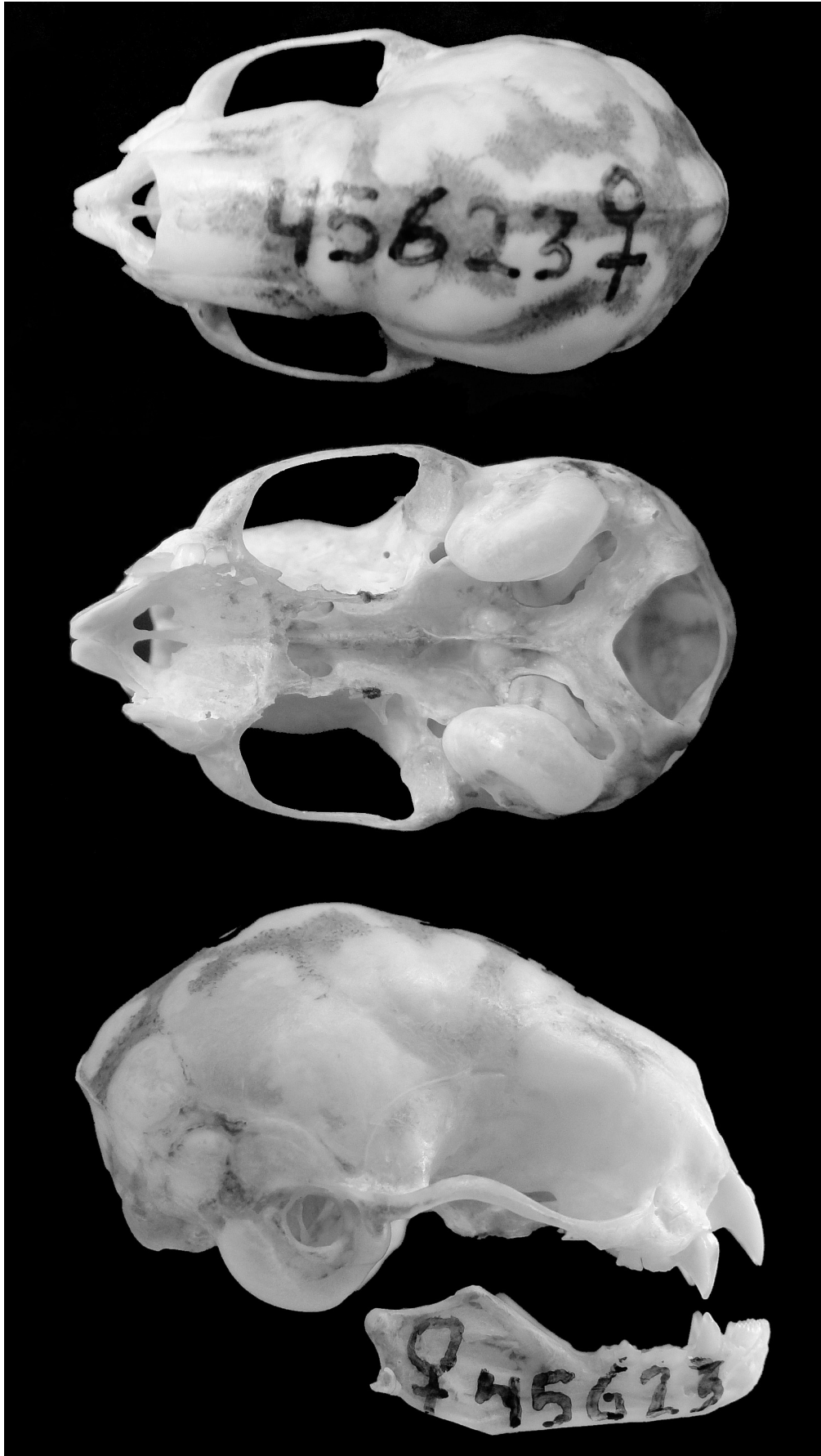
Figura 2. Vista dorsal, ventral y lateral del cráneo (longitud total de 21.96 mm) y lateral de la mandíbula de una hembra adulta de Diphylla ecaudata (C N M A - 4 5 6 2 3), procedente de 2.5 km NE Mesa Prieta, Guanajuato, México.