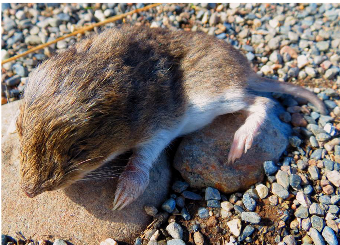
Figura 2. Vista externa de Notiomys edwardsii de Río Serrano, Parque Nacional Torres del Paine, Magallanes, Chile. Se destaca el contraste entre la coloración dorsal y ventral, la coloración anaranjada alrededor del hocico y en los flancos, las orejas pequeñas y escondidas en el pelaje de la cabeza y la cola corta (para otros caracteres, véase el texto).

Este nuevo registro muestra, una vez más, la necesidad de continuar con el trabajo de campo, aún de grupos considerados como bien conocidos como los mamíferos ( D'Elía et al. 2015a ) y/o áreas supuestamente bien conocidas como el sur de Chile (véase Osgood, 1943 ; Rau et al. 1978 ; Johnson et al. 1990 ). Para el Parque Nacional Torres del Paine, Johnson et al. (1990) han citado, pero sin indicar un ejemplar de referencia, a Chelemys delfini , otro ratón cavador de estatus incierto, pero que por sus características más probablemente se trate de un sinónimo de Geoxus michaelsoni ( Teta 2013 ; Teta et al. 2015a ). Así, en el sur de Chile se registran por lo menos tres especies de ratones de