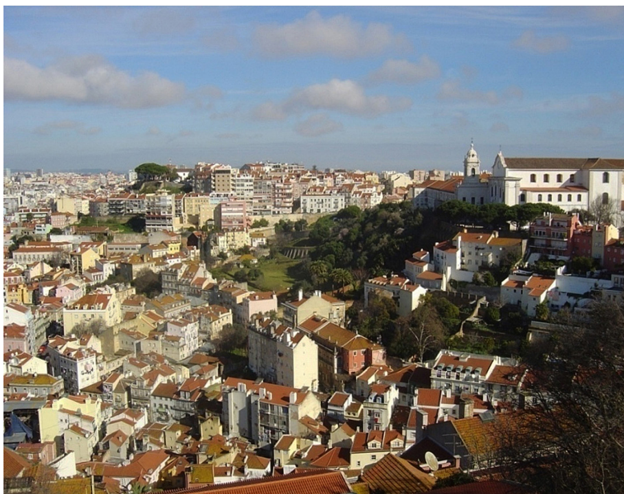
Figura 3 – Diversidade arquitetônica da Mouraria