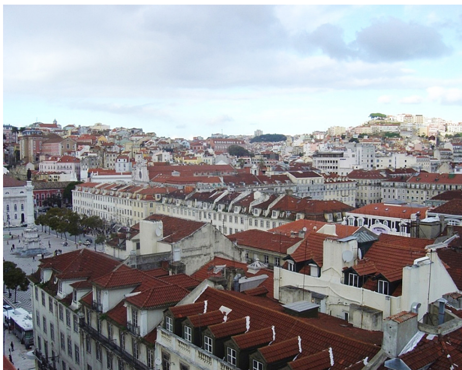
Figura 2 – Plano em xadrez e antigo enobrecimento da Baixa-Chiado