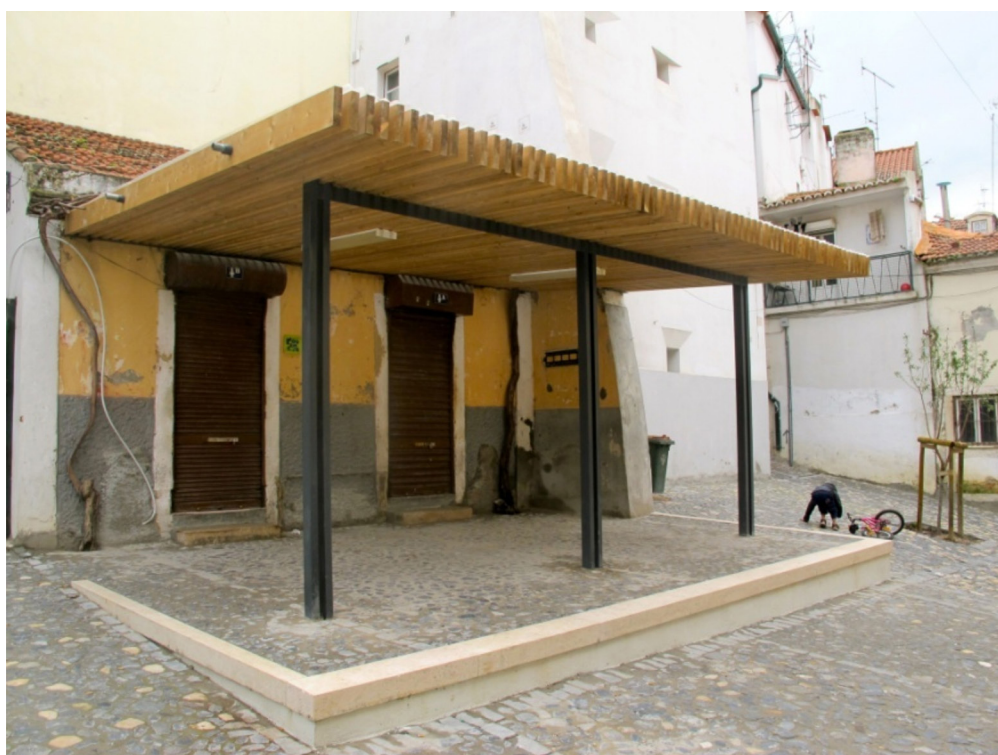
Figure 5 – Esplanada reabilitada de uma tasca na Praça da Severa

as associações presentes no bairro, não exclui a reabilitação de bens e a normalização dos locais comerciais sobretudo se essas populações animam a vida do bairro e incarnam um certo folclore propício às dinâmicas gentrificadoras turísticas (Figura 5). O projeto inclui também ajudas às populações imigrantes (alfabetização, ajuda perante as administrações...), dispositivos sanitários e sociais (para prostituição e tóxico-dependência), mas também um banco do tempo (para mutualizar os serviços prestados entre os habitantes segundo as competências).