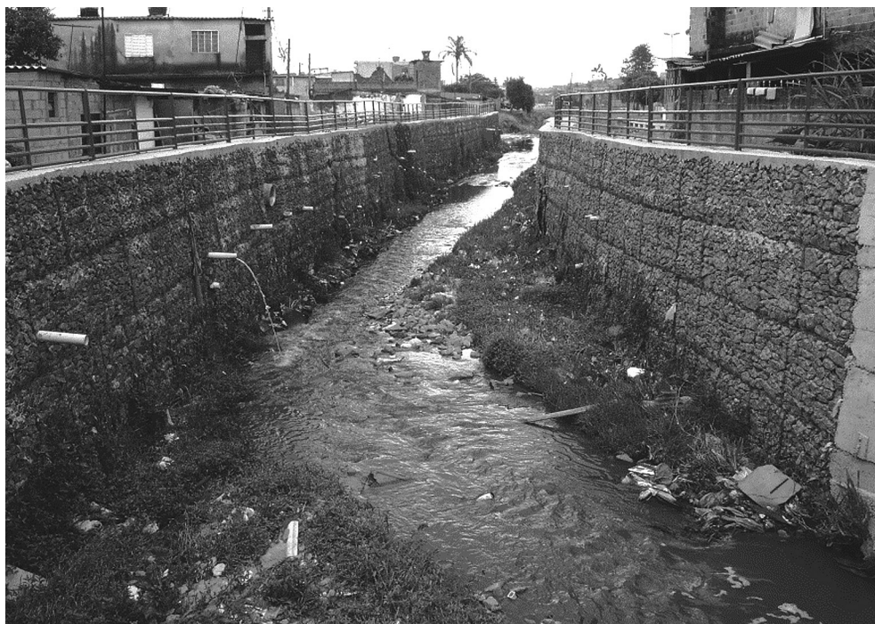
Figura 2 – Trecho do Parque Linear do Ribeirão Itaim: a não completude do sistema de coleta de esgotos mantém a degradação do curso d'água