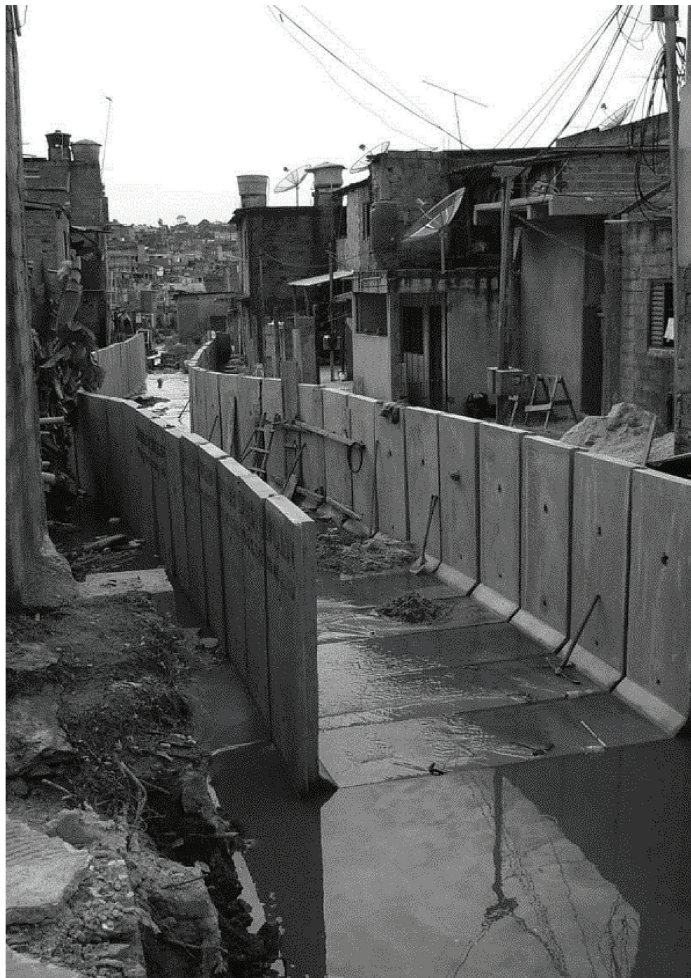
Figura 1 – Urbanização de favela no Recanto do Paraíso, Zona Norte do município de São Paulo