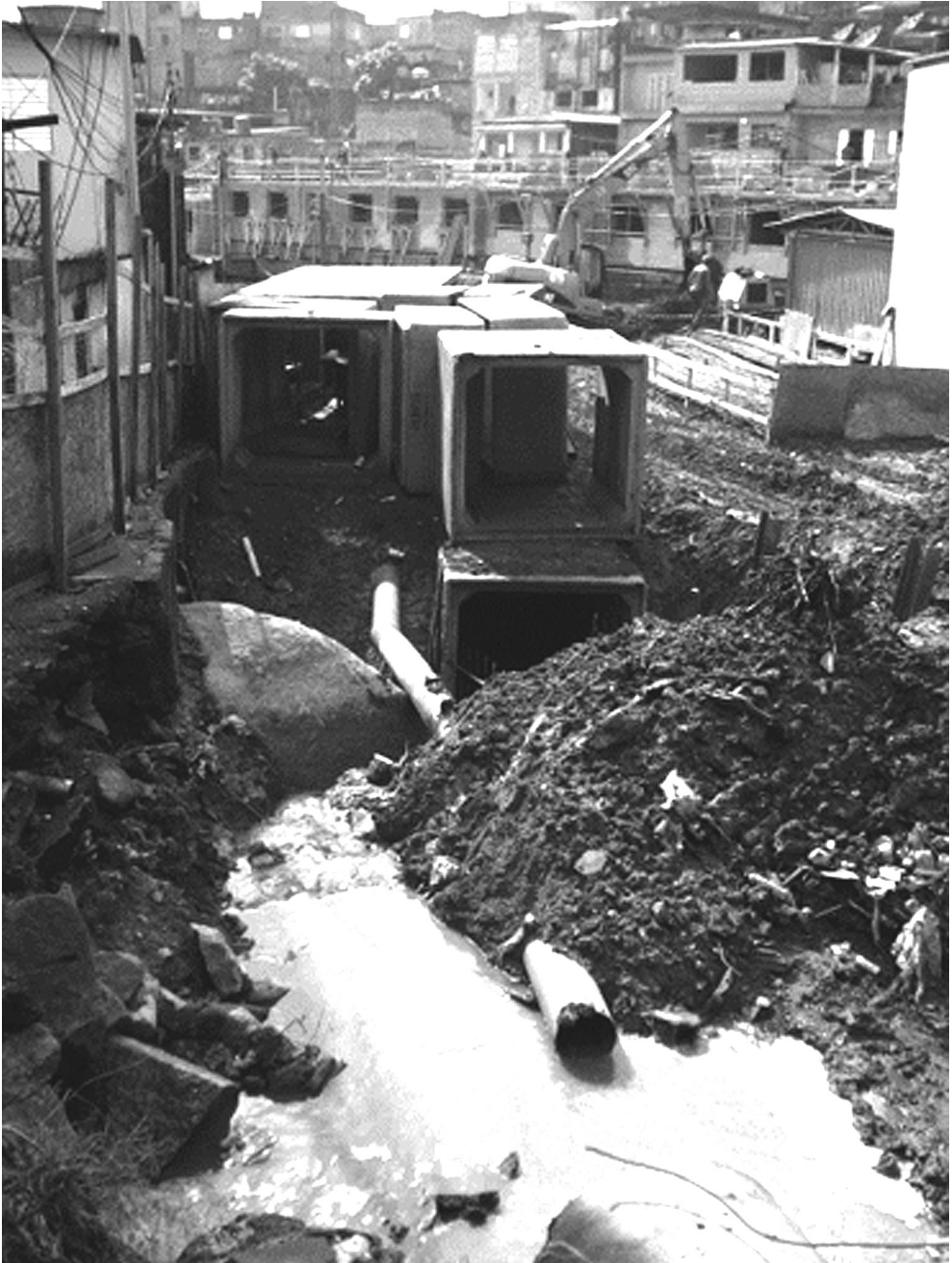
Figura 3 – Canalização de córrego em galeria no Jardim Guarani