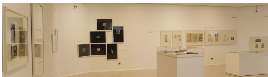
Figura 10: As manhas do Barão.