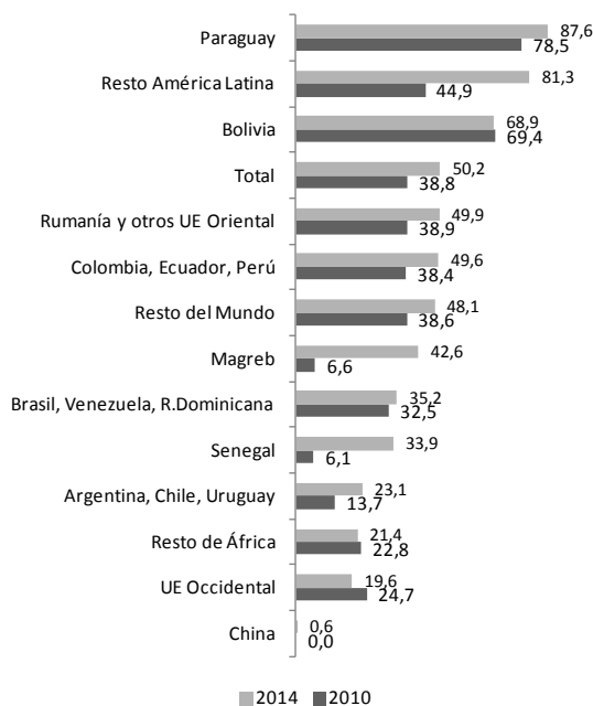
Gráfico 4. Mujeres inmigrantes (16 a 66 años) ocupadas en el servicio doméstico según principales procedencias (2010-2014) (%)

Fuente: Elaboración propia a partir de la EPIE (2010, 2014). Gobierno Vasco.