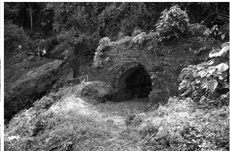
Los socavones de las minas

Hacia el medio día nos dirigimos al municipio de Falan. Estudiantes y profesores de la Normal Superior del pueblo nos guiaron hasta lo que los lugareños denominan como Ciudad Perdida, y que son en realidad Los Reales de Minas de Lajas, que han sido explotadas desde el siglo XVI hasta hoy. Los estudiantes entraron a los socavones, conocieron los respiraderos y por momentos reflexionaron sobre las formas de explotación indígena en la Colonia. Terminado el recorrido y de regreso a los buses, el río Jiménez, que bordea la cordillera central, permitió otro momento de encuentro entre los estudiantes de ambas instituciones.