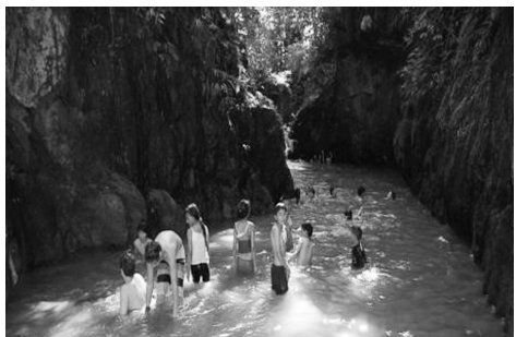
Todos al agua en la quebrada Jiménez