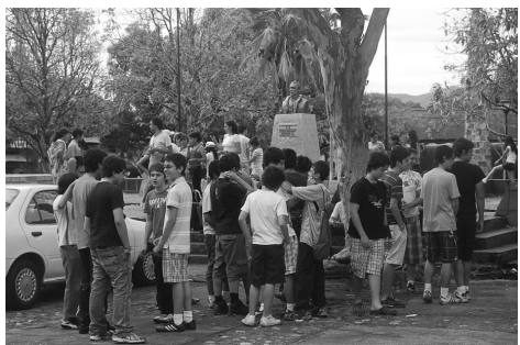
¿ Y qué encontramos en la Villa de San Sebastián de Mariquita ?

Teniendo como centro la Plaza Central de Mariquita, los estudiantes visitaron: La tumba del conquistador fundador de la ciudad de Bogotá, La Segunda Casa de la Expedición Botánica, La Casa del Conquistador, La Casa de Acuñaamiento de la Moneda y La Ermita que fue construida por Gonzalo Jiménez de Quesada.