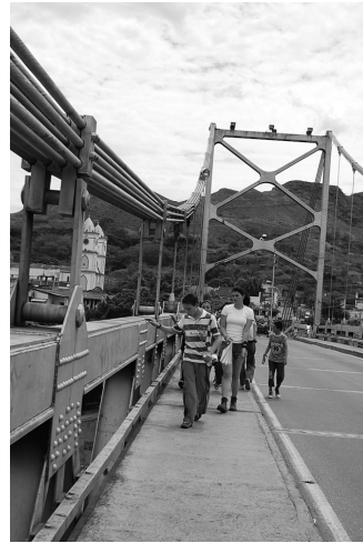
La frontera entre Tolima y Cundinamarca

Por un accidente automovilístico no se pudo visitar Guaduas. Nos devolvimos por la vía Cambao. A Bogotá llegamos a las 9:30 p.m.