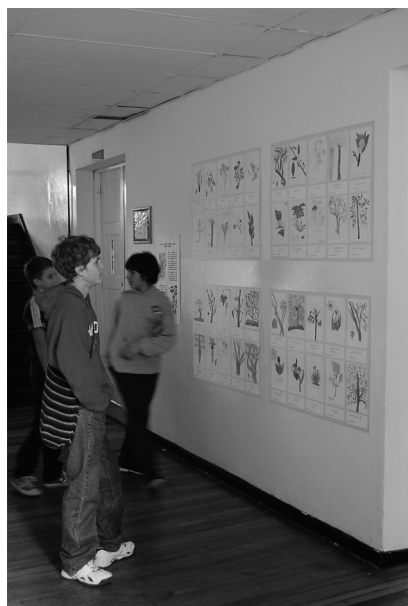
Exposición de los trabajos realizados en el Jardín Botánico

Los pintores de la Expedición Botánica: de la percepción de la Colonia a la expresión del Siglo XXI. Desde la concepción del proyecto fue clara la necesidad de vincular al profesor de arte, pues La Expedición Botánica, aparte de tener una relevancia histórico científica, se convirtió en un espacio de expresión plástica de inigualable valor. No se puede olvidar que fue la única expedición que tuvo una escuela de pintura. Esta actividad se llevó a cabo en las instalaciones del Jardín Botánico de Bogotá y fue el cierre del proyecto.