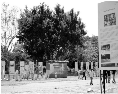
Echamos a rodar la memoria en Armero

Este sitio, desconocido por un alto porcentaje de los estudiantes causó un gran impacto, especialmente después de la narración de lo sucedido por parte de un guía, quien a su manera y combinando realidad con algo de ficción, hizo conmover a un auditorio flotante.