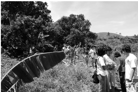
Y empezamos a caminar

Este sitio, desconocido por un alto porcentaje de los estudiantes causó un gran impacto, especialmente después de la narración de lo sucedido por parte de un guía, quien a su manera y combinando realidad con algo de ficción, hizo conmover a un auditorio flotante.