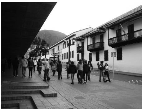
Y recordando.... Reconocemos a Bogotá a través de la Candelaria

Resultados: esta actividad contó con el entusiasmo de los estudiantes y maestros del nivel, quienes de una manera vivencial se transportaron por unas horas al pasado, se re-crearon con él y de regreso al presente su visión sobre el mismo también tuvo otra mirada, pues en los espacios de clase los estudiantes valoraron positivamente la actividad en la medida en que constataron que lo escrito en sus cuadernos, lo narrado en las clases y lo expuesto en los libros de consulta tenía que ver con su realidad. Además, la manera como se organizaron los grupos facilitó el proceso de socialización en los tres cursos, pues en cada uno de ellos se abrió espacio para compartir impresiones y la experiencia misma de la salida, teniendo presente los objetivos de la misma.