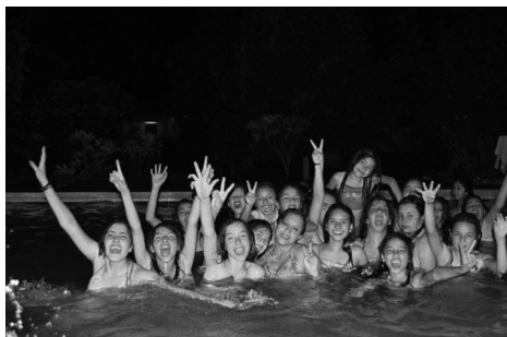
La foto del recuerdo

Teniendo como centro la Plaza Central de Mariquita, los estudiantes visitaron: La tumba del conquistador fundador de la ciudad de Bogotá, La Segunda Casa de la Expedición Botánica, La Casa del Conquistador, La Casa de Acuñaamiento de la Moneda y La Ermita que fue construida por Gonzalo Jiménez de Quesada.