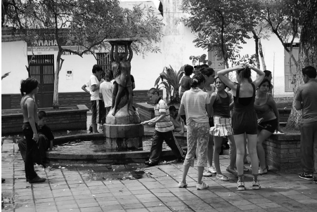
La ciudad de los Puentes y sus fantasmas