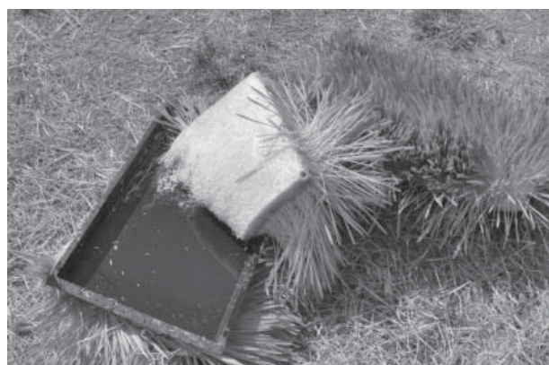
Figura 8. Se aprecia el tapete conformado por la relación paja/grano/sistema radicular, así como su sanidad.

tiempo, con un suministro de agua, el FVH puede durar de (2 a 3) días más, pero no se recomienda extender el tiempo de cosecha, pues el contenido nutricional empieza a alterarse significativamente y pierde mucho valor nutritivo (Valdivia, 1996). El FVH se debe ofrecer combinado con otros alimentos de tal forma que la ración sea completa.