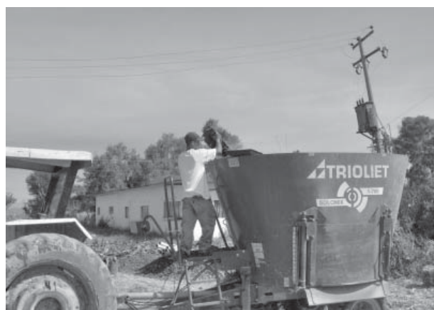
Figura 5. Equipo utilizado por el productor para obtener una mezcla más uniforme en la alimentación del ganado lechero.

El costo del FVH se determinó con base en la cantidad requerida por charola y su conversión a un kg de FVH, basándose en la producción de 9 kg de FVH por charola. Se calculó el costo de la semilla, considerando un kg por charola a $2,15/kg; el empleo de 6,92 litros de agua a 0,17 centavos/litro; el desinfectante empleado fue a razón de 250 ml para el total de charolas, a un costo de 0,95 centavos/charola; el jornal de mano de obra a $5/charola/8 días. El costo de la inversión inicial e infraestructura fue de $186 685,25 valor que se amortizó a siete años, considerando una producción de 504 kg/día en un lapso de un año.