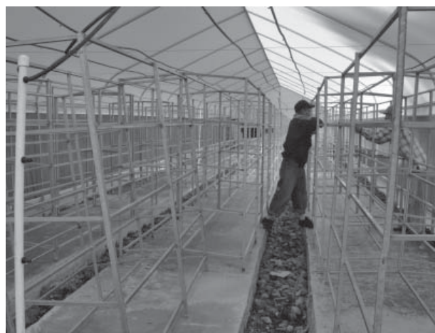
Figura 2. Vista de colocación de los sectores de riego.

Por cada sector se ubicaron charolas de (40 x 60) cm y por cada nivel se colocaron 60 charolas que multiplicadas por los 4 niveles utilizados arroja una cantidad de 240 charolas por sector de riego; la cantidad total que se emplearon en todo el macrotunel para la producción de forraje verde hidropónico fue de 1 440 charolas. Para el sistema de producción se empleó el sistema de riego por goteo, con cintilla de calibre 6000