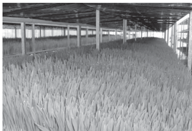
Figura 7. Crecimiento alcanzado por el forraje verde hidropónico con riego por goteo.

El forraje producido debe ser ingerido el mismo día de cosecha, lo que no impide almacenarlo por más