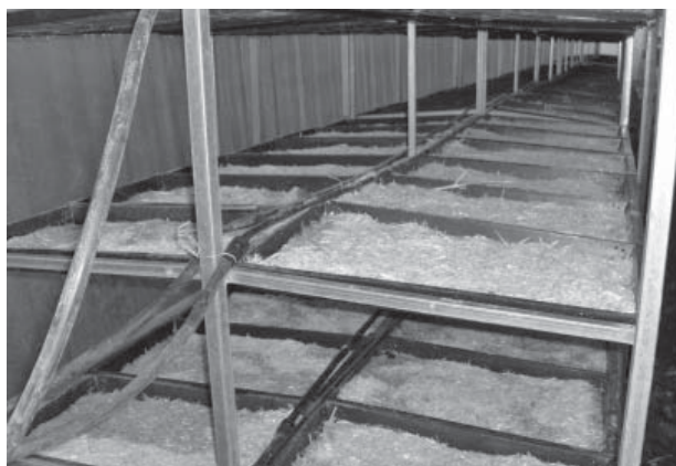
Figura 4. Colocación del sistema de riego por goteo a lo largo de los módulos de producción de FVH y la distribución de la humedad generada a lo largo y ancho de las charolas de germinación.

Para evitar problemas de falta de uniformidad en la distribución del agua en la charola se utilizó paja de trigo molida, en una mezcla de paja/grano de 200 g de paja por 600 g de grano de cebada, dicha mezcla se distribuyó a lo largo y ancho de la charola, éstas tenían una inclinación de 1,0 cm (1,5% de pendiente) lo que garantizó un escurrimiento adecuado favoreciendo