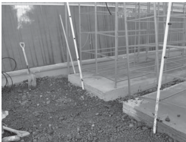
Figura 1. Dimensiones de los módulos para la colocación de las charolas de producción de forraje

En su interior se colocaron estructuras metálicas con PTRs de una pulgada, soldadas en forma de prisma rectangular con 2,40 m de largo x 1,20 m de ancho y 1,70 m de alto, conformada por 5 niveles separados a 45 cm cada uno de ellos (figura 1).