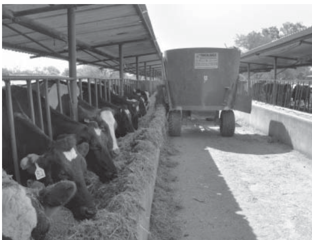
Figura 9. Alimentación del ganado con la mezcla de forraje verde hidropónico.

Una vez obtenida la producción se procedió a ofrecer FVH mezclado con ensilado de maíz, concentrado, alfalfa y paja de sorgo, mezcla que fue excelentemente aceptada por los animales (figura 9). La aceptación del FVH concuerda con lo obtenido por Valdivia (1996), quién realizó pruebas de consumo en cerdos, ovinos, aves, equinos, camélidos y bovinos sin problemas de aceptación. Valdivia (1996), en una prueba de producción con ganado lechero, alimentó a cinco vacas durante 15 días con 18 kg/vaca/día, además de ensilaje de maíz, concentrado, rastrojo de maíz y melaza, granos de sorgo y maíz molidos y obtuvo los siguientes resultados: La producción de leche se elevó en un 18%; la producción de grasa fue un 15,2 % mayor en las vacas bajo estudio; durante seis días después de que se eliminó el suministro de FVH las vacas casi no consumían ensilaje y buscaban su ración de FVH.