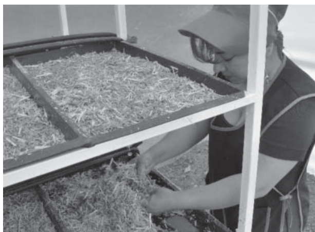
Figura 6. Preparación y desarrollo del forraje manejado con riego por goteo.

El tiempo de riego empleado fue de 2 minutos cada 2 horas por sector, aplicándose 12 riegos durante un día con un total de 24 minutos/día/riego/sector, mencionado por Romero (2009).