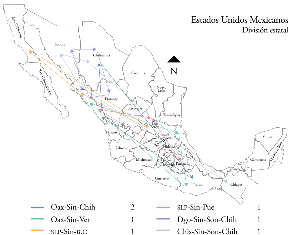
Mapa 4. Trabajadores agrícolas migrantes circulares

ros agrícolas de Oaxaca (Miahuatlán (SS) y Tuxtepec (P) migraban por la ruta Oaxaca-VBJ-Chihuahua y Oaxaca-VBJ-Veracruz, respectivamente; otro de San Luis Potosí (San Antonio (H) se movía entre San Luis Potosí-VBJ-Baja California y uno más andaba por SLP-VBJ-Puebla; uno de Durango recorría la ruta Durango-VBJ-Sonora- Chihuahua; otro de Chiapas (Villa Corso) cubría Chiapas-VBJ-Sonora-Chihuahua y uno más de Chihuahua, circulaba por Chihuahua-VBJ-Oaxaca (ver mapa 4).