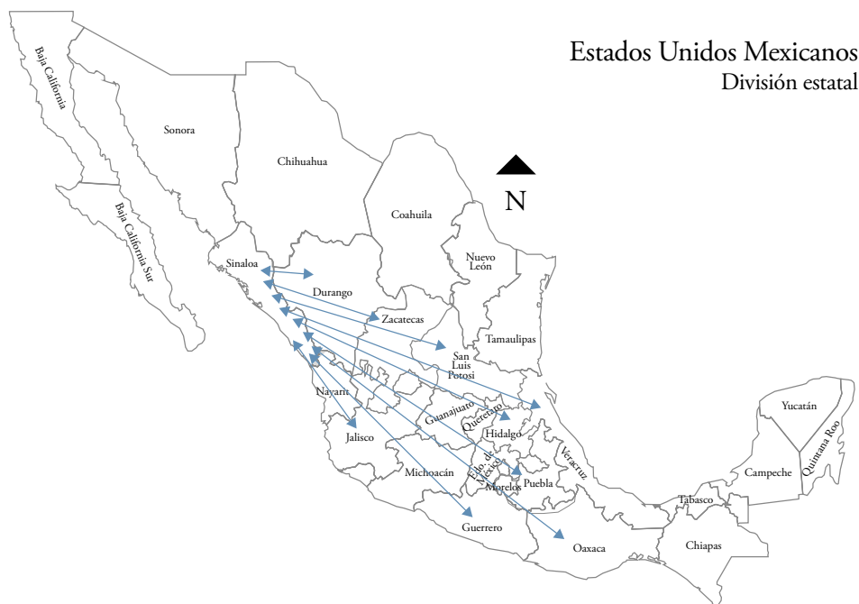
Mapa 3. Trabajadores agrícolas migrantes pendulares

Por otra parte, 31 jornaleros agrícolas migrantes pendulares residían en forma temporal en VBJ como lugar de destino, migrando de ida y vuelta desde los siguientes lugares de origen donde tenían su principal lugar de residencia: 13 de Guerrero (Chilapa (C), Tlapa (M), Ahuacuotzingo (C), Igualapa (CCH), Atoyac (CG); seis desde Durango (Mezquital (S), Canatlán (V)); cuatro partiendo de San Luis Potosí (Tamazunchale (H), Matlapa (H)); tres iniciando en Zacatecas (Miguel Auza); dos comenzando en Oaxaca (Tuxtepec (P)); dos partiendo de Veracruz (Tres Valles (GM)); uno desde Hidalgo (Chapulhuacán); otro a partir de Jalisco, uno más comenzando por Puebla (San Salvador) (ver mapa 3).