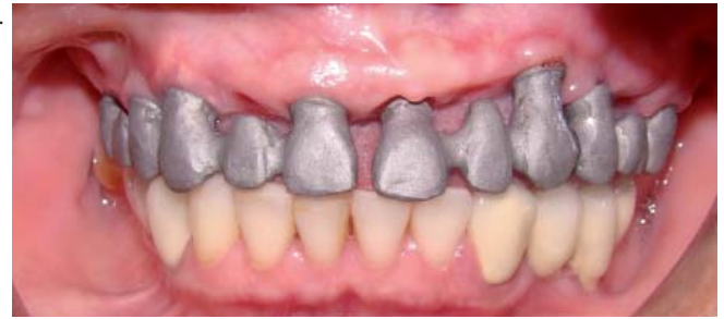
Fig. 6. Prueba de estructuras coladas.

el paralelismo entre los implantes a nivel de las piezas 16/14, 13/11, 21/23, 24/26 (Fig. 5). Se realizó la prueba del fresado de los pilares y se confeccionó a partir de estos las estructuras coladas como puentes de tres unidades (Fig. 6), luego de la prueba de los colados y verificación del asentamiento de dichos colados se procedió a la aplicación de porcelana y prueba de bizcocho verificando las tablas oclusales estrechas, puntos de contactos dirigidos a nivel del eje axial de implante y rampas bajas en las desoclusiones (Fig. 7,8). En la arcada inferior se realizó la nivelación de los bordes incisales desde de las pzas 32-43. Se colocaron implantes oseointegrados para las piezas 36 (4 x 10mm), 45 (4 x 11,5) y 46 (4 x 11,5) colocación posterior de coronas metalo cerámicas cementadas y un puente metal cerámica en pzas 35-33. Se consiguió una oclusión mutuamente protegida con una desoclusión canina derecha e izquierda. Finalmente se realizó la cementación temporal y confección de una férula de protección.