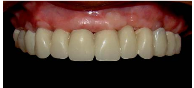
Fig. 4. Provisionalización: manejo de pónicos ováticos.