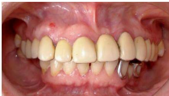
Fig. 1. Caso Clínico inicial.