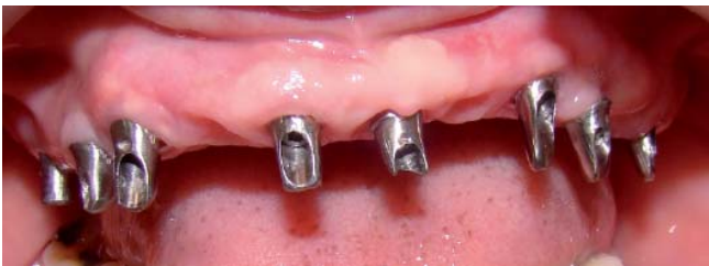
Fig. 5. Prueba de fresado de pilares.