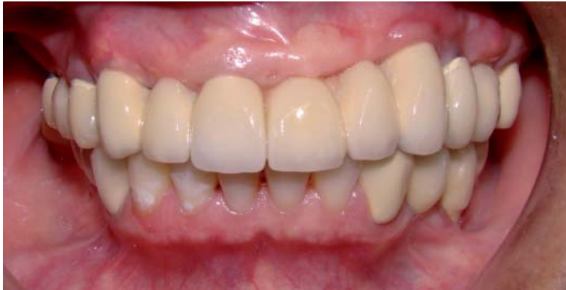
Fig. 7. Prueba de bizcochos.

pronóstico malo o reservado para lo cual debe realizarse un diagnóstico multidisciplinario y la aplicación de una técnica basada en la evidencia científica. Sugirieron que se debe presentar las diferentes posibilidades de tratamiento al paciente alertando sobre las ventajas y desventajas de cada opción en relación a los aspectos biológicos y financieros siendo el paciente el que debe escoger entre las posibilidades presentadas, considerando costo/beneficio. Esto debe registrarse por razones legales en la historia clínica.