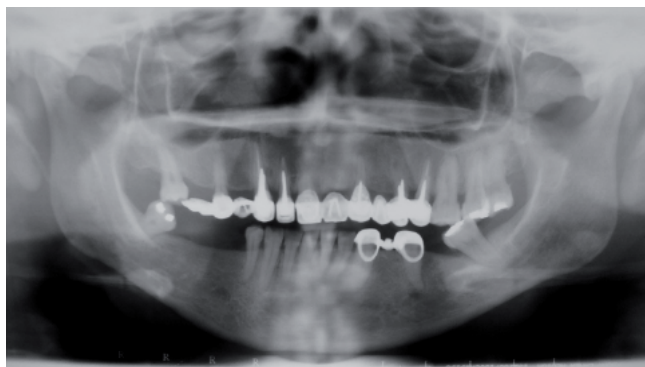
Fig. 2. Radiografía Panorámica inicial.

Debido a la evaluación del costo-beneficio de las opciones de tratamiento propuestas, la paciente decidió por los implantes oseointegrados y por prótesis total fija implanto-soportada, con exodoncia de los dientes remanentes y la confección transitoria de una prótesis total superior y parcial inferior durante el tiempo de oseointegración para una posterior provisionalización superior previa al tratamiento definitivo.