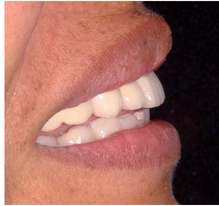
Fig. 8. Sonrisa: vista lateral.

El uso de estrategias estéticas para lograr los contornos de te-