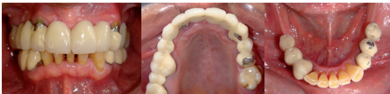
Figura 1. A. Maxima intercuspidación, B. Vista Oclusal Superior y C. Vista Oclusal Inferior

Se procede al retiro de las prótesis fija y se toma una impresión funcional (se combinó silicona por adición de consistencia fluida para conseguir escurrimiento y mediana para que el producto final tenga densidad) para la confección de una placa base y rodete que nos servirá para determinar la dimensión vertical (evaluando el espacio disponible para la confección de la prótesis implanto soportada) así como también el soporte de los tejidos blandos (5) (Figura 3A, 3B y 3C).