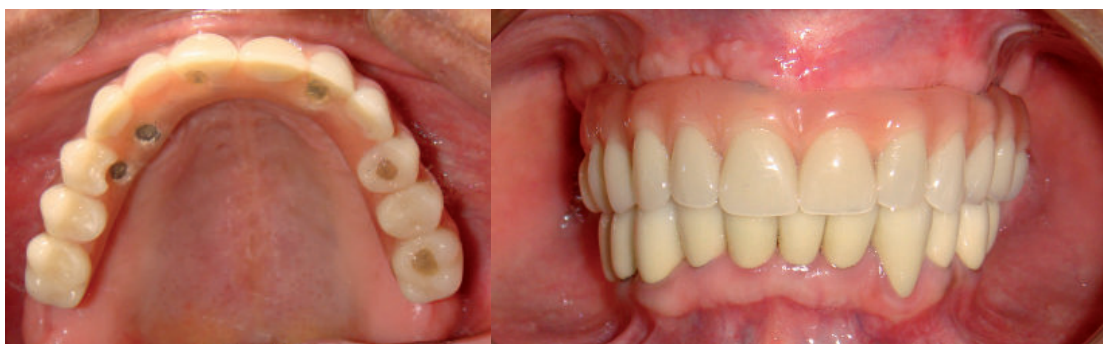
Figura 7A. Vista oclusal y B. Máxima intercuspidación.

Se seleccionaron los pilares y la profundidad del transmucoso con el probador de pilares, todos los pilares empleados fueron Mini Pilar CM Recto (Neodent) los cuales se ajustaron a 30N (según indicaciones del fabricante). Posteriormente se transfirió la ubicación de los pilares para lo cual se ferulizaron los aditamentos de transferencia con barras metálicas unidas con acrílico de combustión completa (alta estabilidad dimensional luego de la polimerización), se verifica que la cubeta individual confeccionada asiente adecuadamente, en caso la ferulización no permita un ingreso adecuado, se procede a desgastar la cubeta. Una vez tomada la impresión se colocan los análogos y alrededor de ellos silicona para simular la encía en el modelo.