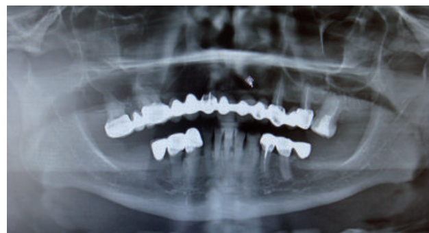
Figura 2. Radiografía panorámica inicial del paciente

Se duplica el encerado realizado para la confección de una guía tomográfica, en la cual se preparan ductos, los cuales son rellenos con gutapercha en barra, los cuales servirán como marcadores al momento del examen de imágenes, ubicando la probable posición en la cual se colocara el implante respectivo y a su vez con gutapercha rosada (conos de gutapercha empleados en endodoncia) en la zona vestibular para evaluar el contorno (Figuras 4A y 4B).