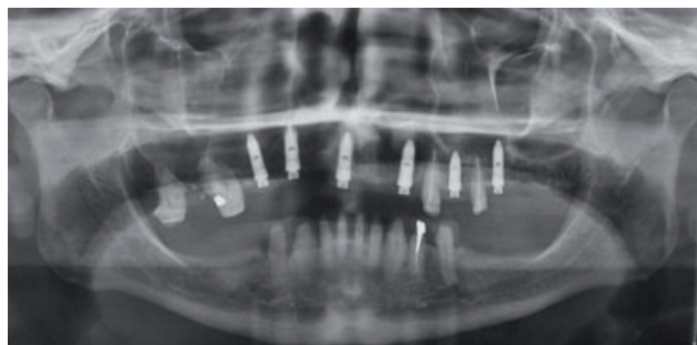
Figura 6. Radiografía panorámica final

Se seleccionaron los pilares y la profundidad del transmucoso con el probador de pilares, todos los pilares empleados fueron Mini Pilar CM Recto (Neodent) los cuales se ajustaron a 30N (según indicaciones del fabricante). Posteriormente se transfirió la ubicación de los pilares para lo cual se ferulizaron los aditamentos de transferencia con barras metálicas unidas con acrílico de combustión completa (alta estabilidad dimensional luego de la polimerización), se verifica que la cubeta individual confeccionada asiente adecuadamente, en caso la ferulización no permita un ingreso adecuado, se procede a desgastar la cubeta. Una vez tomada la impresión se colocan los análogos y alrededor de ellos silicona para simular la encía en el modelo.