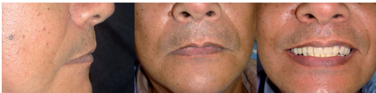
Figura 3. A. Soporte labial