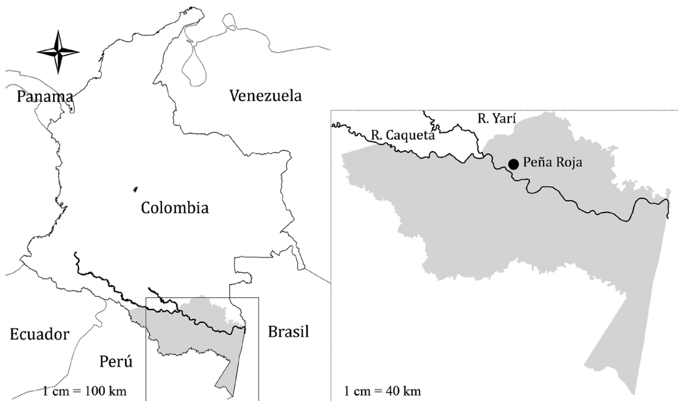
Figura 1. Localización del área de estudio en la región de Araracuara, Amazonia Colombia (arriba).