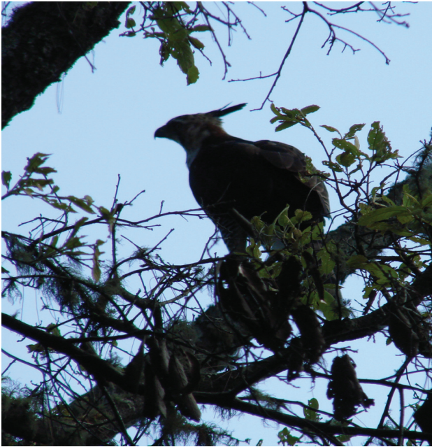
Figura 2. Fotografía de un juvenil de águila elegante ( Spizaetus ornatus ) en un bosque de encino-pino de la Reserva de la Biosfera de Manantlán, Jalisco-Colima, en vista de perfil, donde se aprecia la silueta con la cresta característica.