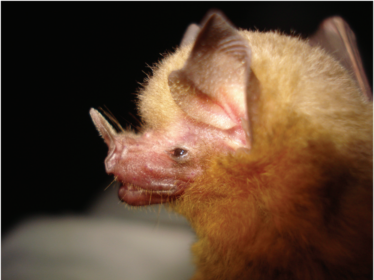
Figura 2. Fotografía del ejemplar de Lampronnycteris brachyotis capturado en Espita, Yucatán, México.