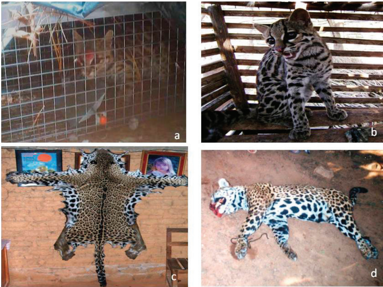
Figura 5. a), ejemplar macho en cautiverio de Leopardus wiedii proveniente de la localidad 14; b), individuo macho de L. wiedii , mantenido en cautiverio proveniente de la localidad 21; c), piel de un macho de Panthera onca de la localidad 15; d), hembra adulta de P. onca recién cazada de la localidad 17.