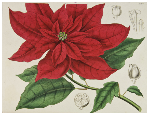
Figura 4. Ilustración botánica de nochebuena descrita como Poinsettia pulcherrima en Graham (1836b).

desde la época prehispánica en lo que es hoy el Distrito Federal (Sahagún, 1979), y la presencia de cultivares mexicanos en la Nueva España se observa en la ilustración de Navarro (1992), en la cual se dibuja una nochebuena con inflorescencias de más de una hilera brácteas (fig. 3). Incluso es posible que Joel Roberts Poinsett se haya llevado plantas con cierto grado de manejo, ya que se observan plantas con inflorescencias dobles en ilustraciones de Graham (1836b) (fig. 4). También es posible que existan variantes novedosas de nochebuenas en el Distrito