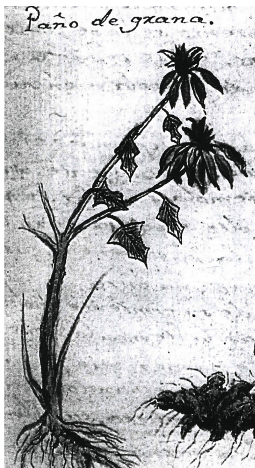
Figura 3. Nochebuena nombrada como «pañó de grana» en Historia Natural o Jardín Americano del año 1801 (Navarro, 1992). Ilustración de Euphorbia pulcherrima con inflorescencias dobles.

H: haplotipo; H_d : diversidad haplotípica; k: promedio de número de diferencias nucleotídicas; S: número de sitios segregantes; SD: desviación estándar; \theta_w : diversidad genética; \pi : diversidad nucleotídica.