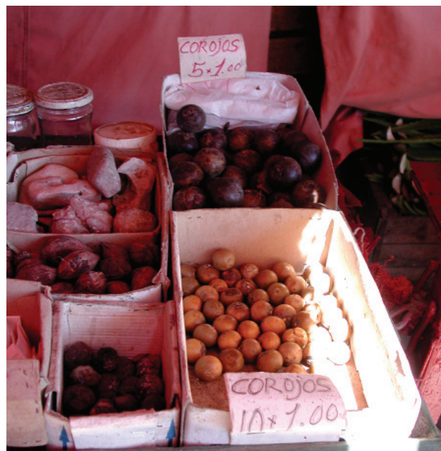
Figura 3. Venta de semillas, raíces, cortezas y resinas de uso medicinal.