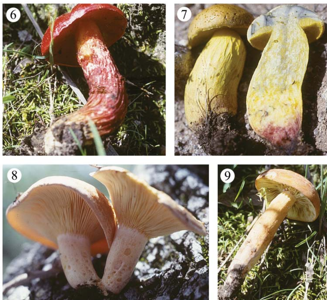
Figuras 6-9. 6. Boletus frostii (MEXU 23301). 7. Buchwaldoboletus hemichrysus (CESUES 37). 8. Lactarius chrysorheus (CESUES 105). 9. Lactarius volemus (CESUES 123).