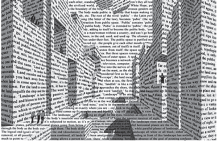
Vito Acconci: "City of words" (1999)

Ante el azar de una invitación como es el próximo medio siglo de existencia de la UCB, inventamos el sentido que dicha lanzada de dados puede tener, en