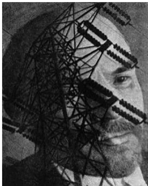
Gustav Klutis: Fotomontaje de Lenin en la campaña de electrificación (1925)

La Unión Soviética impuso su sistema y modelo a casi todos los países del bloque de una manera muy clara y notoria 5 . Por tanto, entender el funcionamiento y los problemas de la Unión Soviética, es entender el funcionamiento y muchos de los problemas del bloque. Esos problemas crónicos e inherentes del sistema –al menos eso se pretende demostrar– lo llevaron al colapso. Por esta misma razón, en el presente trabajo no se describirán a detalle los hechos que llevaron al fin del socialismo en Europa oriental 6 , ya que esto complicaría demasiado al texto.