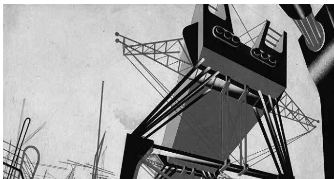
Yakov Chernijov: “Fantasía arquitectónica” (1933)